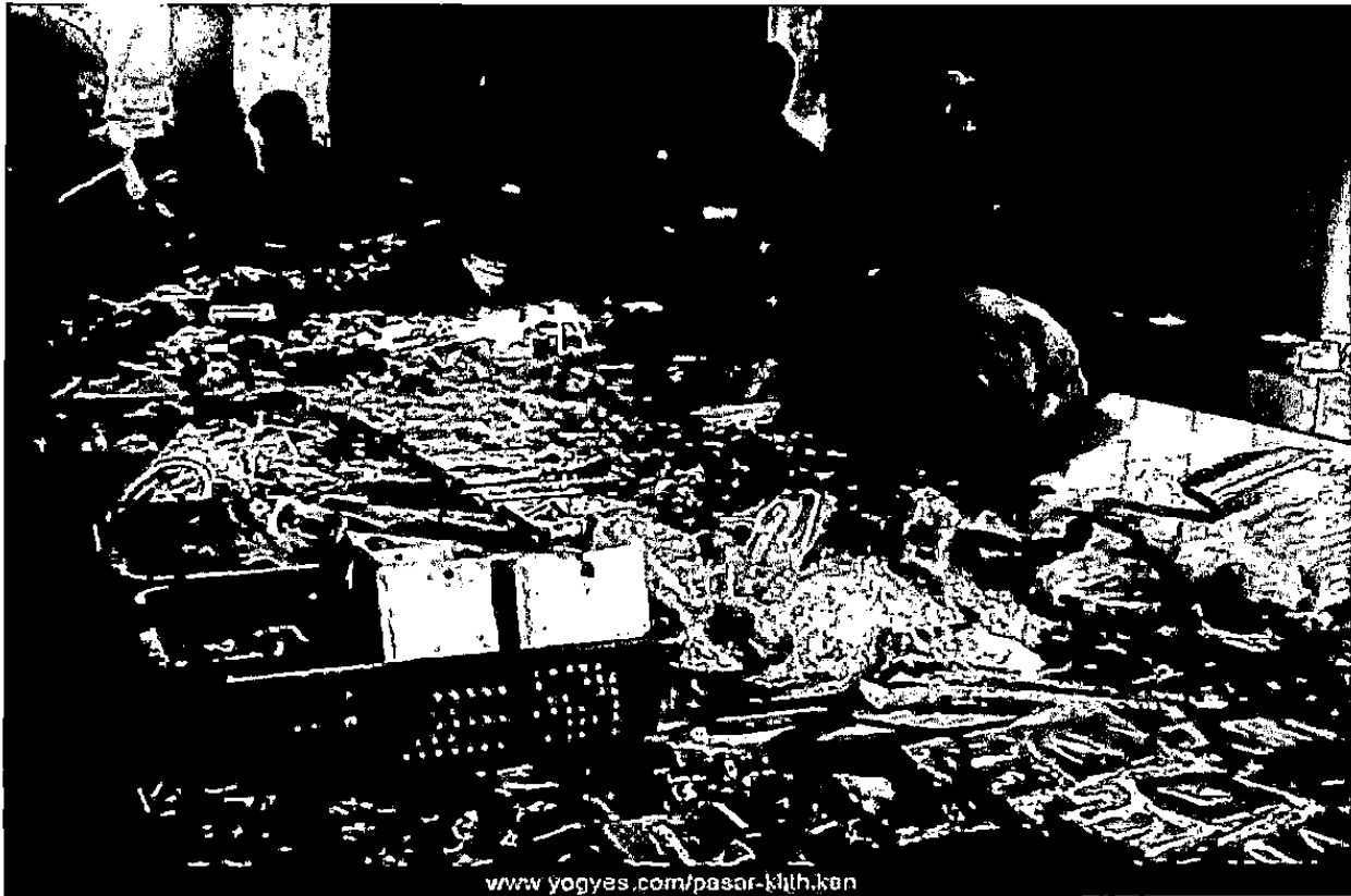
Gb.4. Menjual Onderdil Motor di Mangkubumi