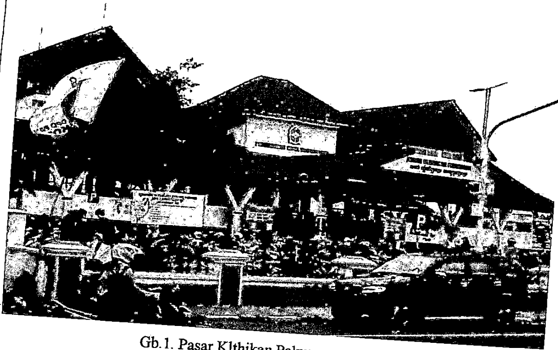
Gb.1. Pasar Klthikan Pakuncen