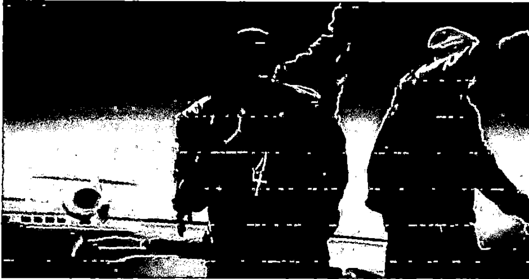
Gambar 2. 1. Dalam adegan tersebut seorang rapper mengacungkan jari tengah yang ditujukan kepada orang Arab yang menurut mereka rakus.