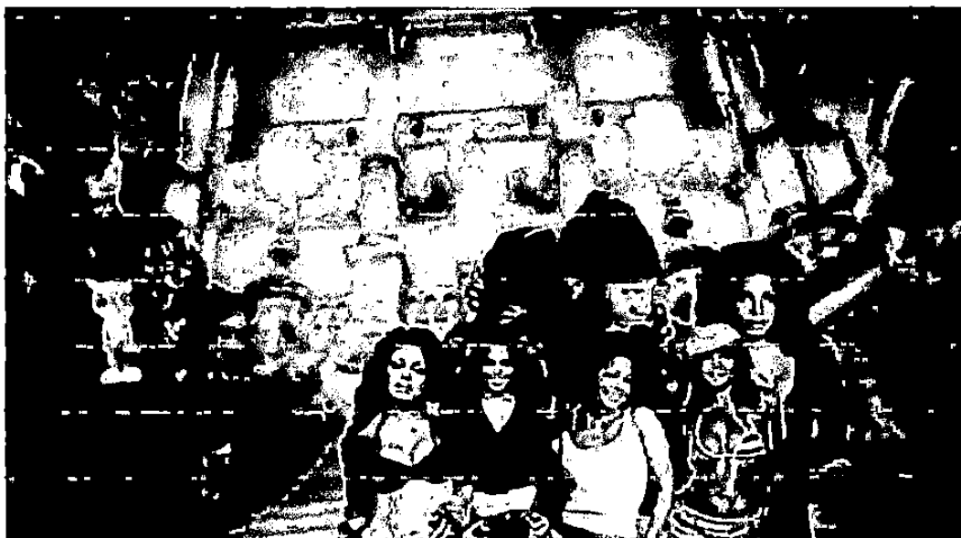
Gambar 2. 0.

Dalam adegan di video klip tersebut seseorang memamerkan uang.