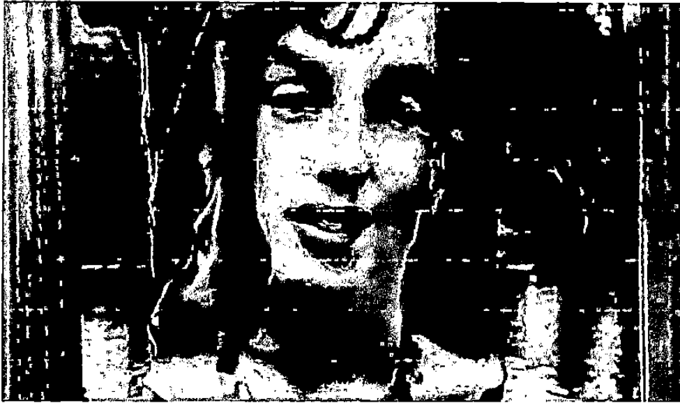
Gambar 1. 6.

Perempuan yang memakai baju wajah artis Marlyne Monroe yang dijuluki sebagai Perempuan Seks yang disamakan dengan orang Muslim yang ada dalam video klip tersebut.