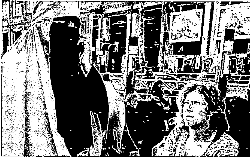
Gambar 1. 5.

Perempuan Muslim memakai penutup muka yang dianggap masyarakat Amerika aneh atau sebagai teroris.