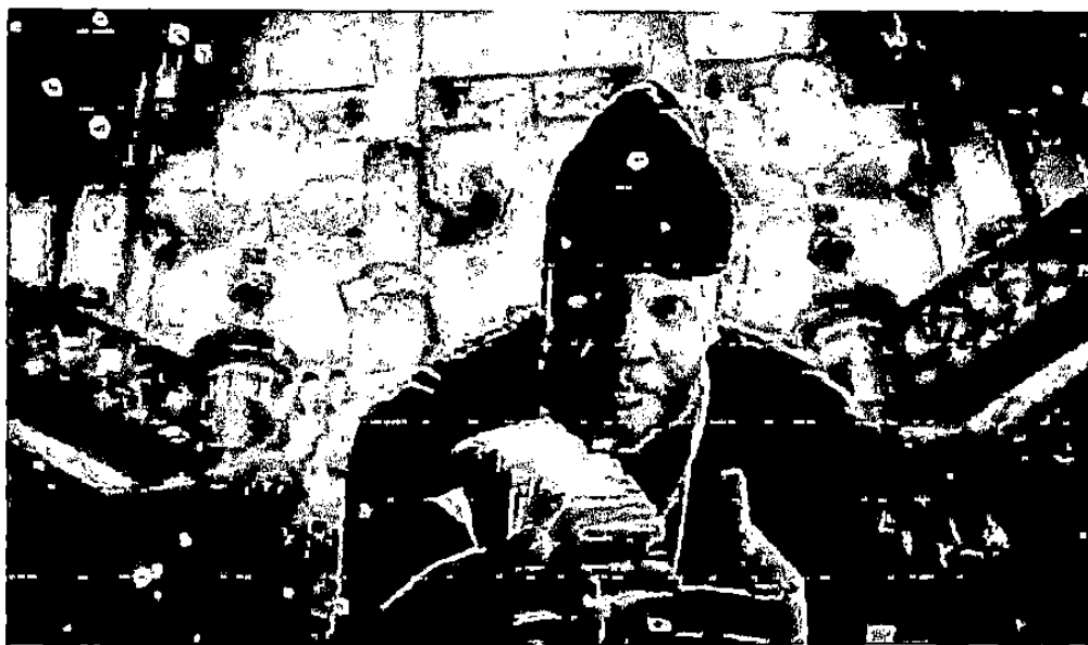
Gambar 1. 9.

mewah, rumah mewah, pesawat pribadi, klub sepakbola, keliling Dunia bersama perempuan-perempuan cantik dan seksi.