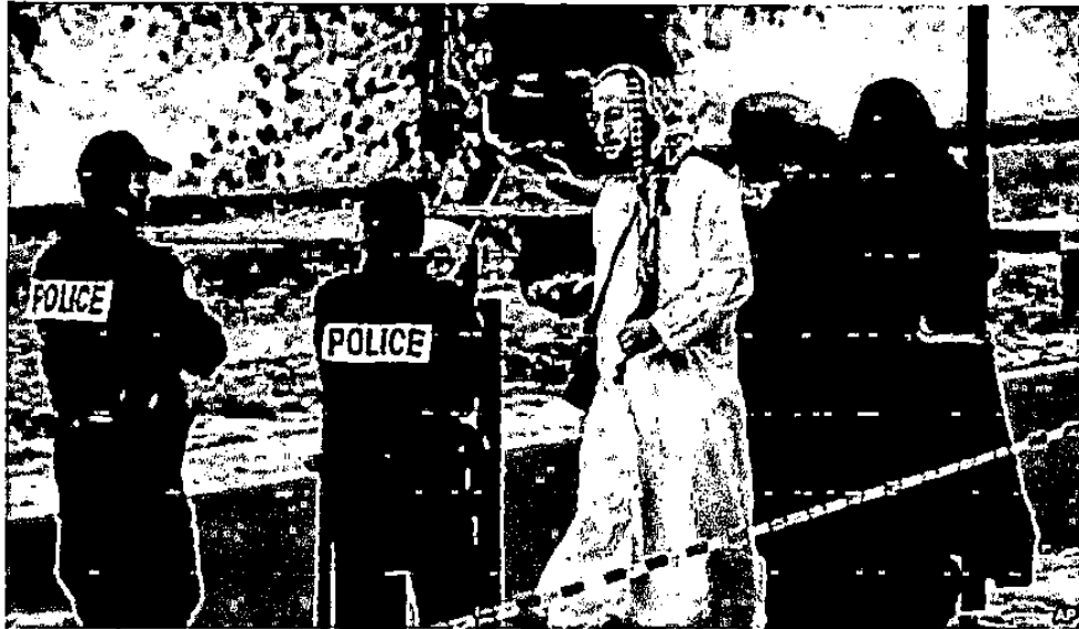
Gambar 1. 4.