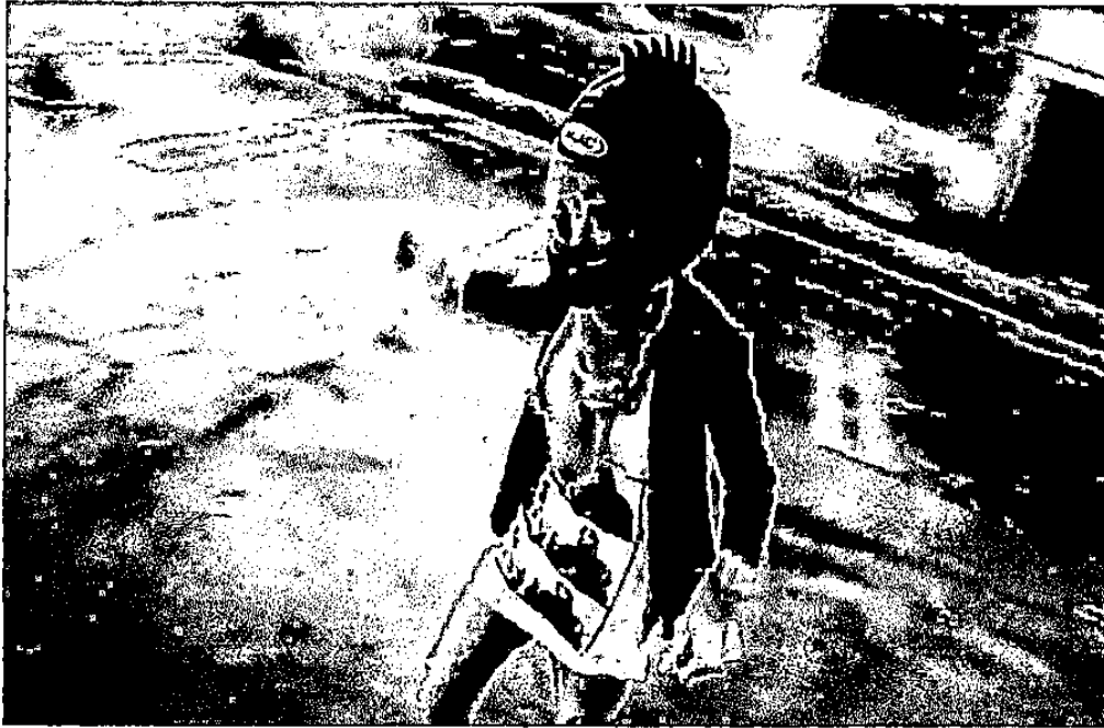
Gambar 1. 8.

Adegan perempuan yang bermain skateboard dengan memakai helm layaknya seperti laki-laki punk.