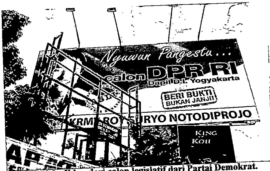
Gambar 1.1 : Iklan dari calon legislatif dari Partai Demokrat.

Yogyakarta. Partai politik berusaha membangun citra “ Ngayogyakarta ” dengan menjual isu keistimewaan dalam aktivitas komunikasi politik menjelang pemilu 2014. Hal ini bisa dilihat terutama dari iklan luar ruang para caleg dan partai politik yang menampilkan isu keistimewaan dalam copy iklannya.