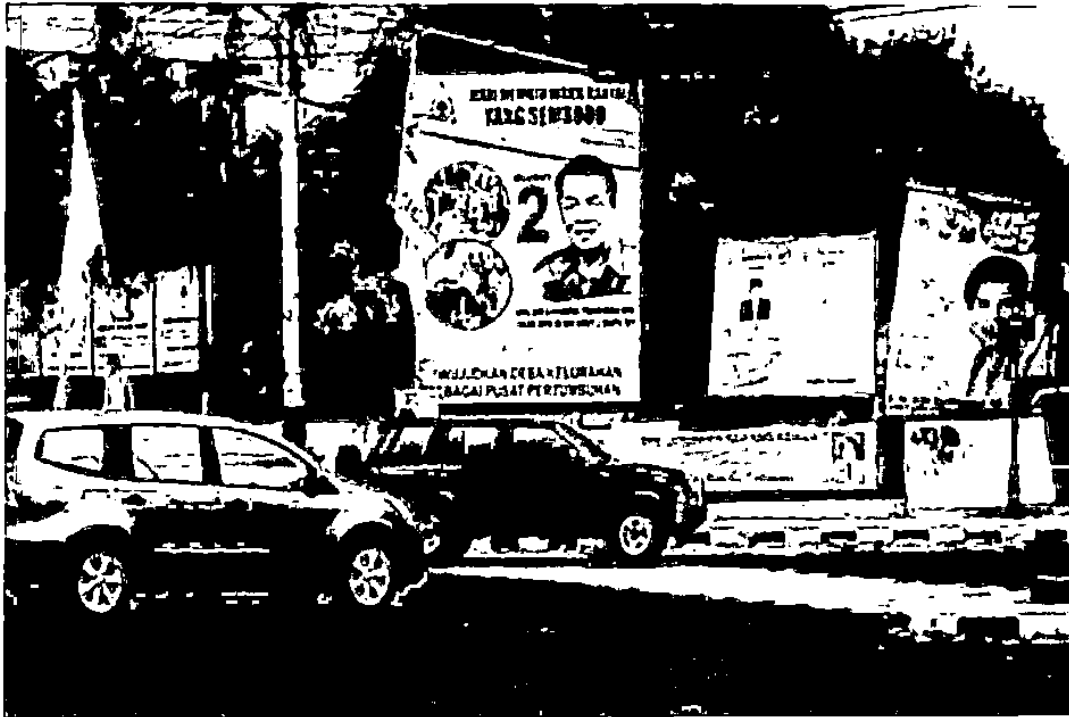
Gambar 1.2 : Foto calon legislatif dari Partai Golkar. (Foto oleh Rahman, diambil di Jl. Jend. Sudirman, Yogyakarta).