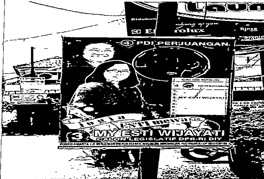
Gambar 1.4 : Iklan dari calon legislatif dari Partai PDI Perjuangan.

(Foto oleh Rahman, diambil di Jl. PGRI, Sonosewu, Yogyakarta, 1 Maret 2014).