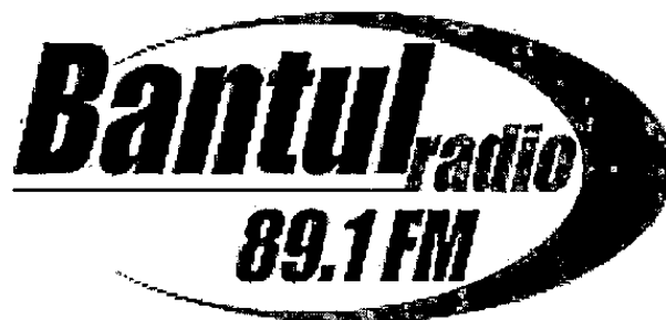
Gambar 2.1. Logo Bantul Radio 89.1 FM