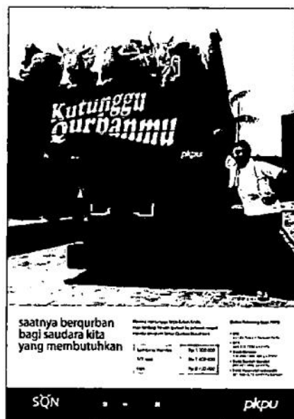
Iklan Cetak Sebar Qurban Nusantara PKPU “Kutunggu Qurbanmu”