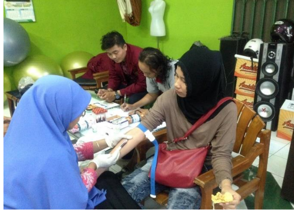
Pengambilan darah responden