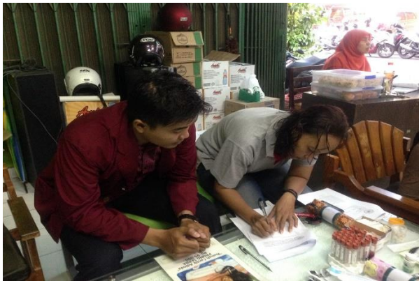
Pengisian informed consent