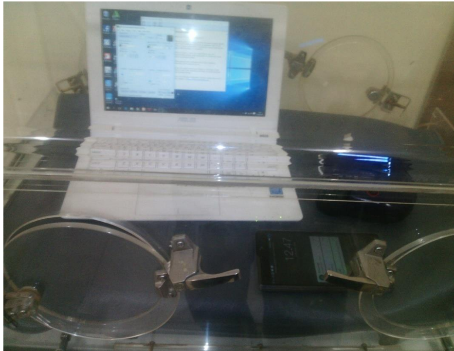
Gambar 4.3. Pada pengukuran di dalam incubator