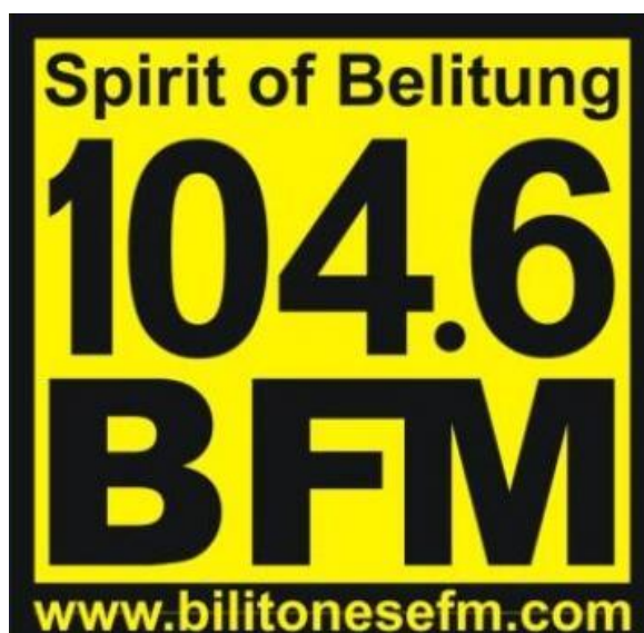
Gambar 2.1. Logo BFM Radio 104,6 FM FM