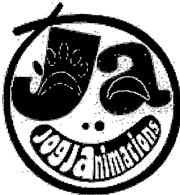
Gambar 2.1. Logo Jogjanimations