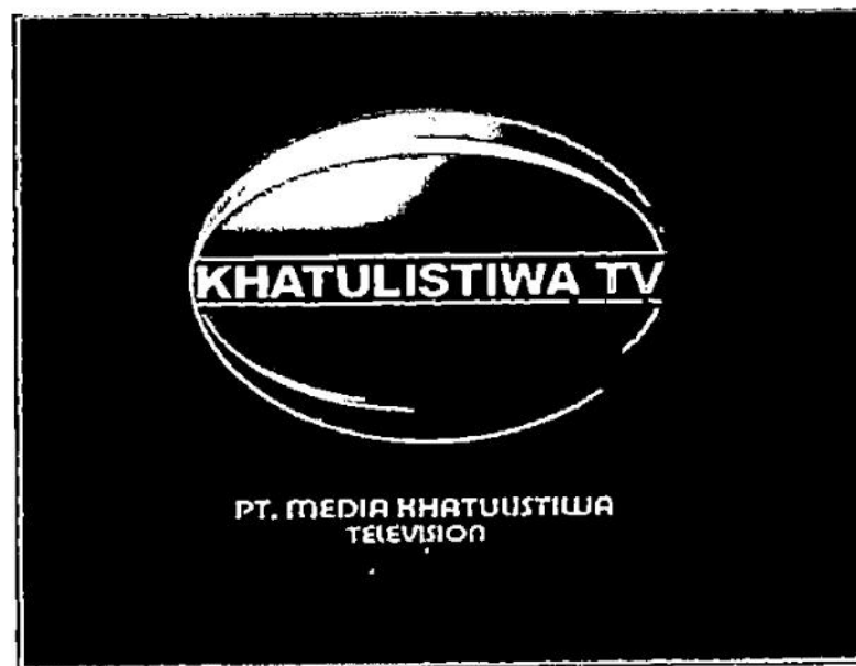
Logo Khatulistiwa TV