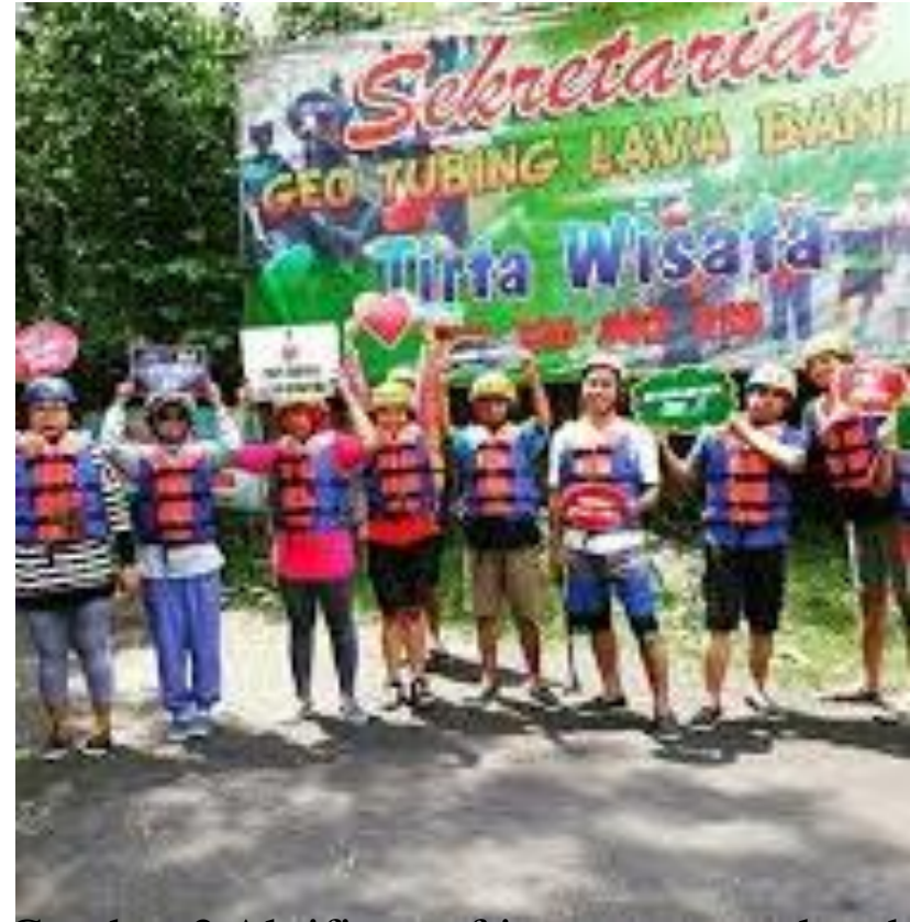
Gambar 2 Aktifitas rafting menggunakan ban di Dusun Sumber Kidul