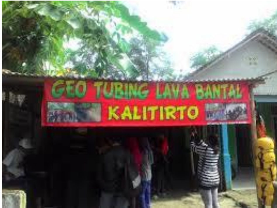
Gambar 1 Kantor usaha bisnis rafting di Dusun Sumber Kidul