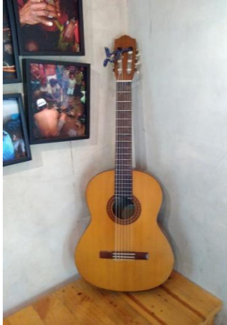
Fasilitas Tambahan, Gitar.