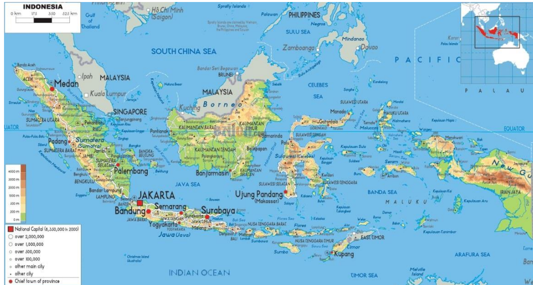
Gambar 3.0 Peta Negara Indonesia