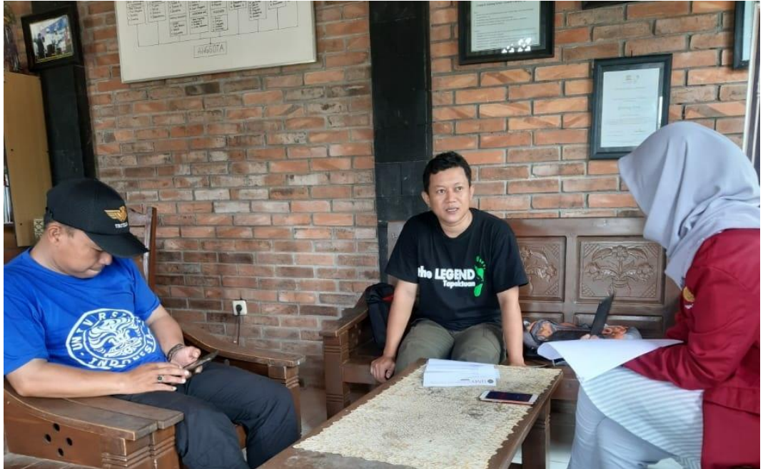
(Wawancara Bersama Pengurus Pokdarwis)