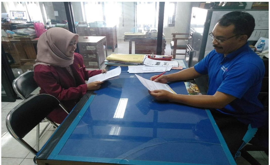
(Wawancara Bersama Dinas Pariwisata Kabupaten Gunungkidul)