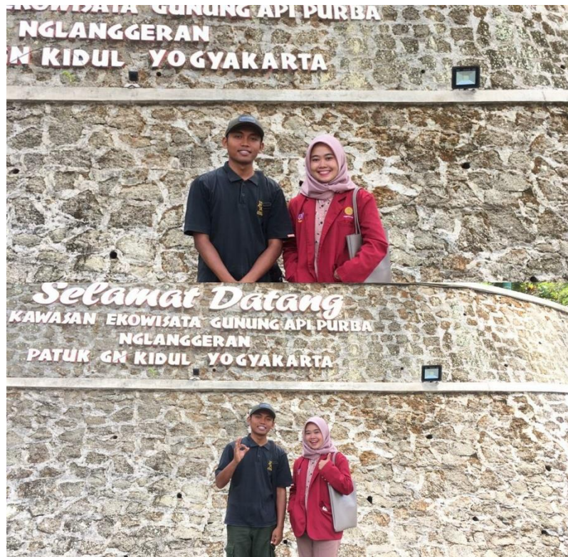
(Pasca Wawancara Bersama Pengurus Karang Taruna)