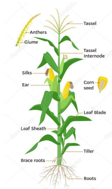
Gambar 1. Morfologi tanaman jagung

Tanaman jagung yang memiliki nama latin Zea mays L. merupakan tanaman berumah satu Monoecious di mana letak bunga jantan terpisah dengan bunga betina pada satu tanaman (Muhadjir, 1988). Maka pada tanaman jagung umum terjadi apabila dilakukan penyerbukan silang. Klasifikasi dari tanaman jagung yaitu Kingdom Plantae (Tumbuhan), Divisi Spermstophyta, Sub Dua Kelas Monocotyledoneae, Ordo Poales, Famili Poaceae, Genus Zea , Spesies Zea mays L. (Tjitrosoepomo, 1983) dalam Bahiyah (2012)