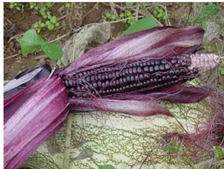
Gambar 4. Jagung varietas Ungu (Puslitbangtan Pangan, 2014b)

sebagai antioksidan di dalam tubuh untuk mencegah terjadinya aterosklerosis, penyakit penyumbatan pembuluh darah. Antosianin bekerja menghambat proses aterogenesis dengan mengoksidasi lemak jahat dalam tubuh, yaitu lipoprotein densitas rendah. Kemudian antosianin juga melindungi integritas sel endotel yang melapisi dinding pembuluh darah sehingga tidak terjadi kerusakan.