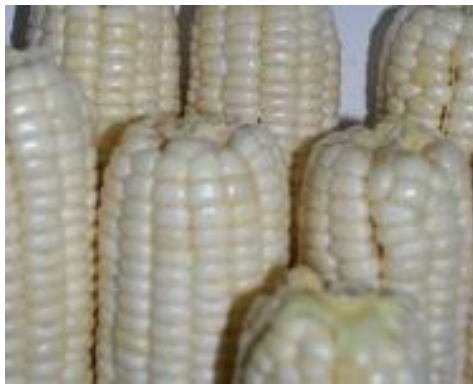
Gambar 3. Jagung varietas Pulut (Puslitbangtan Pangan, 2014a)

Jagung varietas Pulut ( waxy corn ) merupakan jagung varietas lokal. Jagung pulut dikembangkan di beberapa daerah di Sulawesi Selatan. Memiliki kelebihan yaitu rasanya yang enak dan gurih sehingga bisa digunakan sebagai bahan makanan. Adanya gen resesif wx yang mempengaruhi komposisi kimia pati yang terdapat pada jagung pulut sehingga yang menghasilkan rasa yang enak dan gurih. Kandungan amilopektin pada endosperm jagung varietas Pulut sangat tinggi, hampir mencapai 100%. Endosperm jagung biasa terdiri atas campuran 72% amilopektin dan 28% amilosa (Thomison et al. , 2016). Amilopektin merupakan bentuk pati yang terdiri dari sub-unit glukosa bercabang sedangkan amilosa terdiri dari molekul glukosa tidak bercabang.