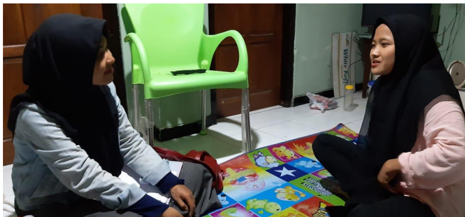
Wawancara Dengan Pengajar Pendidikan Kewarganegaraan