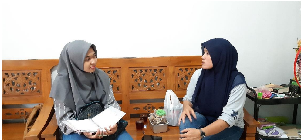
Wawancara Dengan Wali Murid