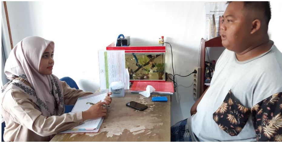
Wawancara dengan Kepala Sekolah Homeschooling Surya Nusantara Yogyakarta