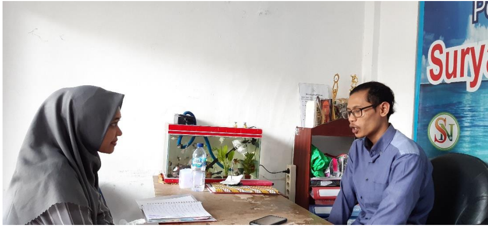
Wawancara Dengan Pengajar Pendidikan Agama Islam