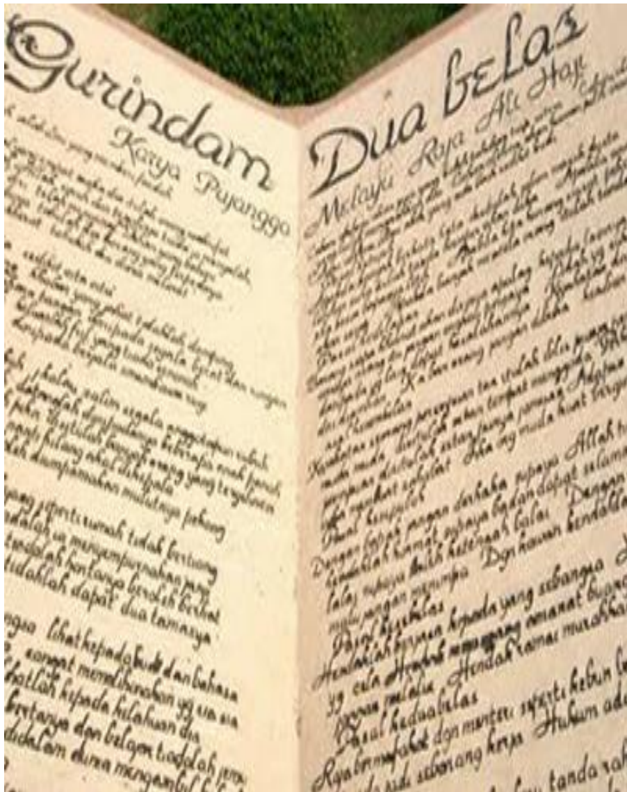
Teks Asli Gurindam Dua Belas Dalam Bentuk Tulisan Tangan Raja Ali Haji.