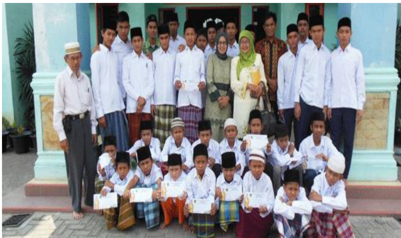
Foto Bersama Anak Panti Waktu Didikan Subuh