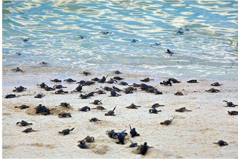
Gambar 5 Pantai Sungai Belacan