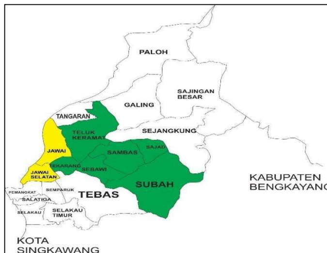
Gambar 2. Peta Kabupaten Sambas