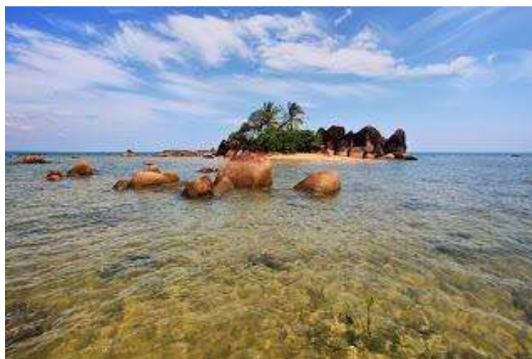
Gambar 7 Pantai Banyuan