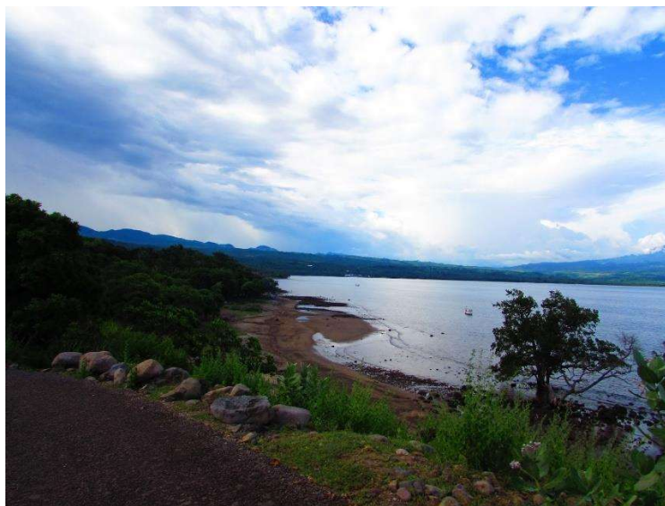
Gambar 6 Pantai Tanjung Bendera