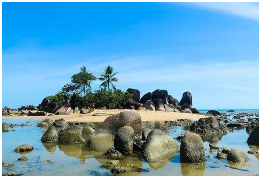
Gambar 3 Pantai Temajuk

Pantai Temajuk menjadi destinasi wisata yang paling banyak digemari di Kabupaten Sambas, pantai ini memiliki letak yang berada pada ekor borneo dengan memiliki hamparan pasir putih, luas wilayah yang sangat panjang, dan memiliki pesona pantai yang sangat menarik. Apalagi daerah lokasi Pantai Temajuk berbatasan langsung dengan negara tetangga Malaysia, wisatawan dari dalam negeri maupun luar negeri (Malaysia) dalam sewaktu-waktu bias menikmati indahny pesona pantai temajuk di daerahnya ini. Di daerah tersebut juga sudah terdapat sejumlah penginapan yang telah disediakan oleh dinas terkait maupun warga setempat. Dari pusat Kota Sambas, butuh waktu 5 jam untuk sampai ke Pantai Temajuk, lokasi yang di tempuh lumayan ekstrim untuk sampai kesana, dan harus menyebrangi sungai besar dengan menggunakan kapal feri.