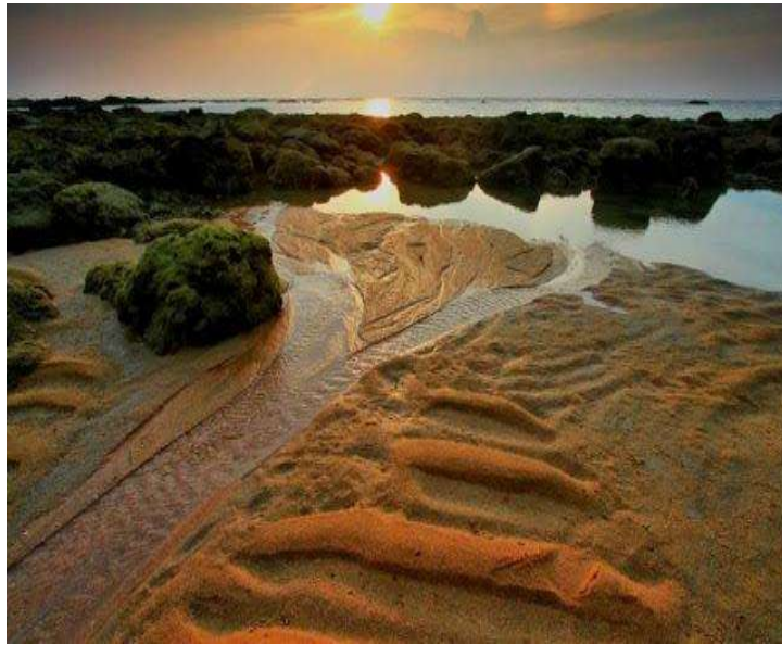
Gambar 8 Camar Wulan