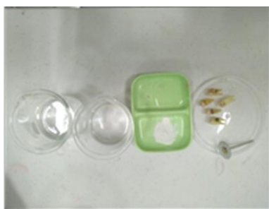
Pembuatan preparat gigi dan menghilangkan kotoran pada gigi menggunakan pumice