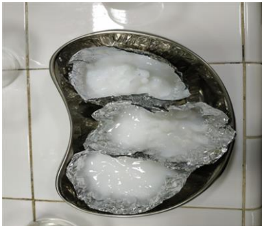
Hasil dari presipitat yang telah di saring