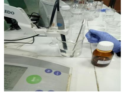
Pembuatan larutan kalsium dengan mengatur Ph