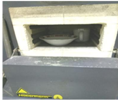
Sintering hasil presipitat yang telah di saring pada 1000°C selama 5 jam