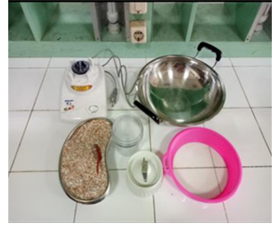
Penghalusan dan penyaringan cangkang telur ayam