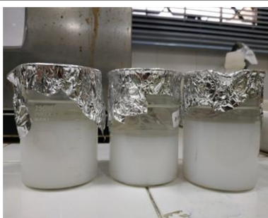
Presipitasi larutan kalsium fosfat selama 24 jam