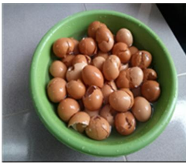
Cangkang telur ayam negeri yang akan dipisahkan dari selaputnya