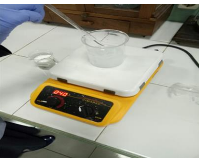
Pencampuran larutan kalsium dan fosfat (tetes demi tetes) dengan pemanasan dan pengadukan