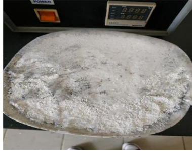
Cangkang telur ayam negeri yang telah di oven 1000°C selama 5 jam