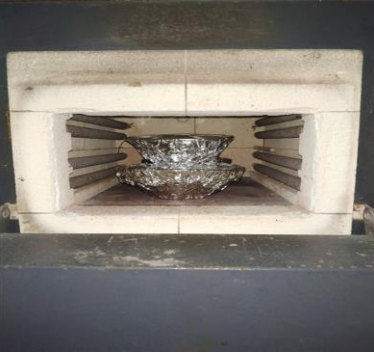
Oven cangkang telur ayam pada 1000°C selama 5 jam