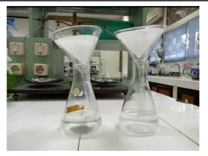
Penyaringan hasil presipitasi menggunakan kertas whatman dan dicuci menggunakan aquabides