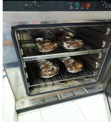
Oven 110° C