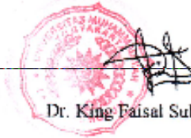
Dr. King Faisal Sulaiman

Mengetahui, 29 Januari 2020 Yang memeriksa,