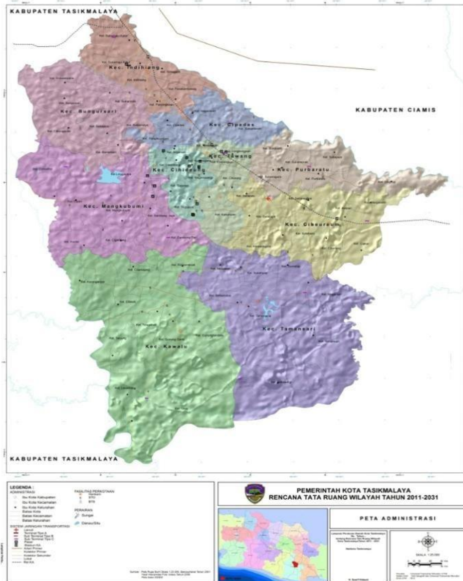
Peta Kota Tasikmalaya