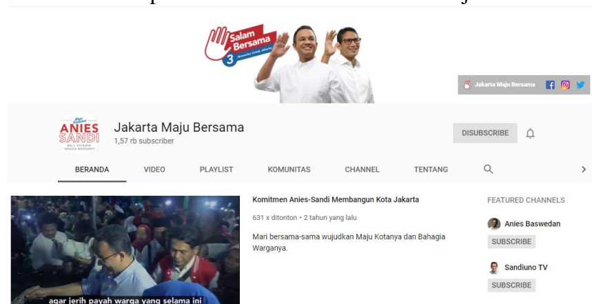
Gambar 3.7 Tampilan Beranda Youtube Jakarta Maju Bersama