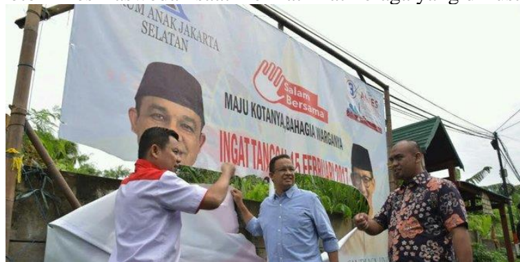
Foto Anies Baswedan saat melihat Alat Peraga yang di rusak

Sumber: website https://jakartamajubersama.com/ diakses pada 18 Oktober 2019 pukul 22.45 WIB