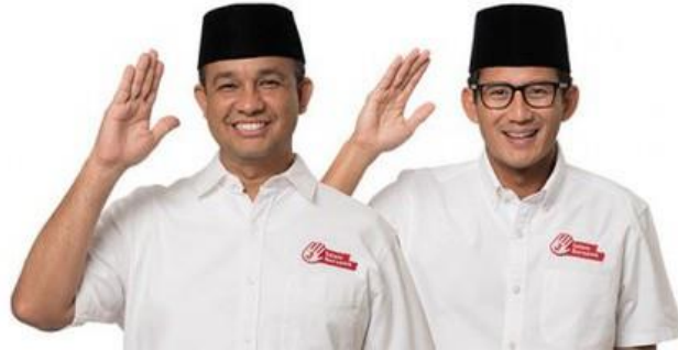
Foto Anies Baswedan dan Sandiaga Uno menggunakan Songkok

Sumber: https://www.instagram.com/jakartamajubersama/?hl=id diakses pada 4 November 2019 pukul 19.25 WIB