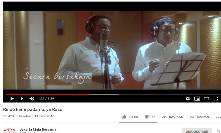
Gambar 3.11 Cuplikan Anies Baswedan dan Sandiaga Uno Rekaman