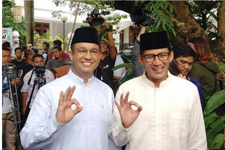
Foto Anies Baswedan dan Sandiaga Uno Gerakan OKE OCE