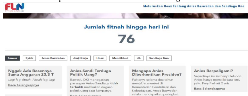
Gambar 3.13 Tampilan Beranda Website Fitnahlagi.com