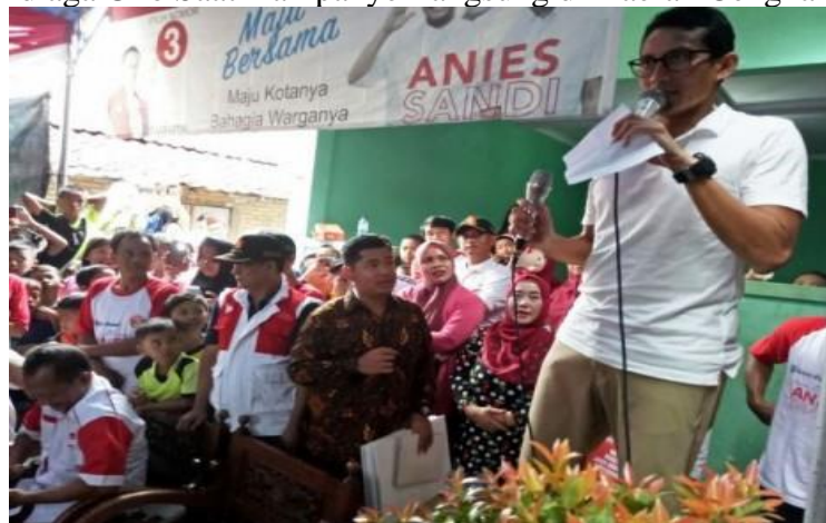
Gambar 3.17 Sandiaga Uno Saat Kampanye Langsung di Daerah Cengkareng

“Setiap harinya Anies maupun Sandi berkunjung minimal tiga lokasi, bahkan paling banyak Anies maupun Sandi pernah berkunjung ke 10 lokasi dalam satu hari” (Wawancara bersama Naufal Firman Yursak pada 5 Agustus 2019 bertempat di Balai Kota DKI Jakarta).