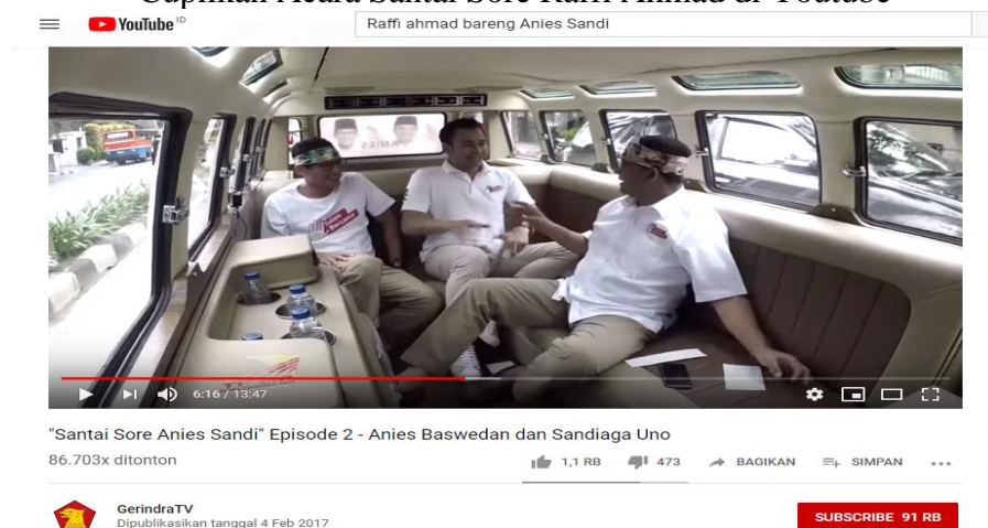
Gambar 3.15 Cuplikan Acara Santai Sore Raffi Ahmad di Youtube