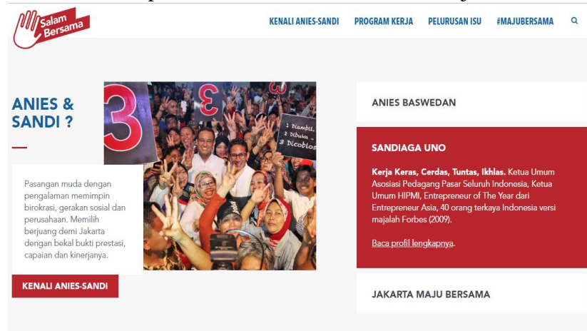
Gambar 3.5 Tampilan Beranda Website Jakarta Maju Bersama