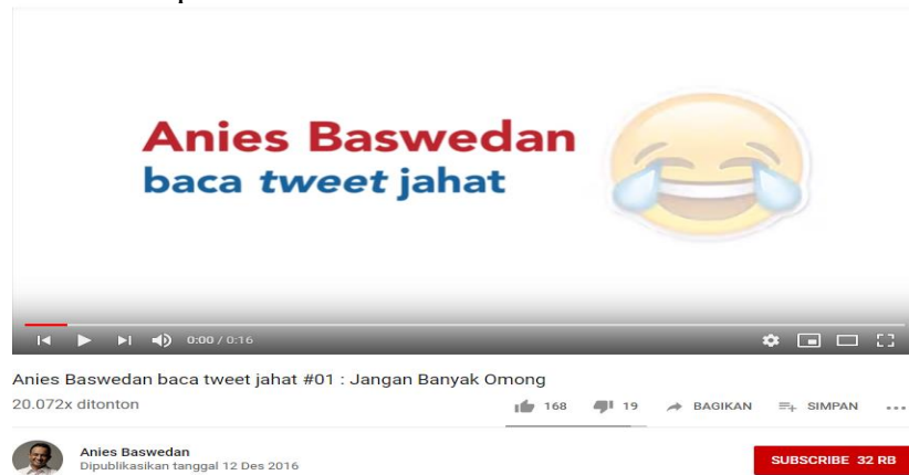
Gambar 3.12 Cuplikan Anies Baswedan Baca Tweet Jahat