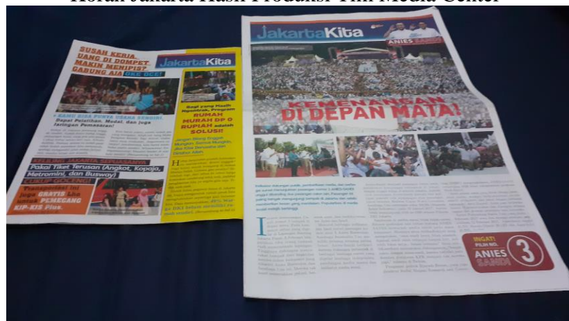
Gambar 3.1 Koran Jakarta Hasil Produksi Tim Media Center

Media koran mampu menjadi panduan bagi relawan dan distribusikan kepada lapisan masyarakat yang sulit tersentuh dengan media lainnya. Melalui koran ini, tim menjemput bola untuk menyampaikan segala bentuk informasi mengenai pasangan ini.