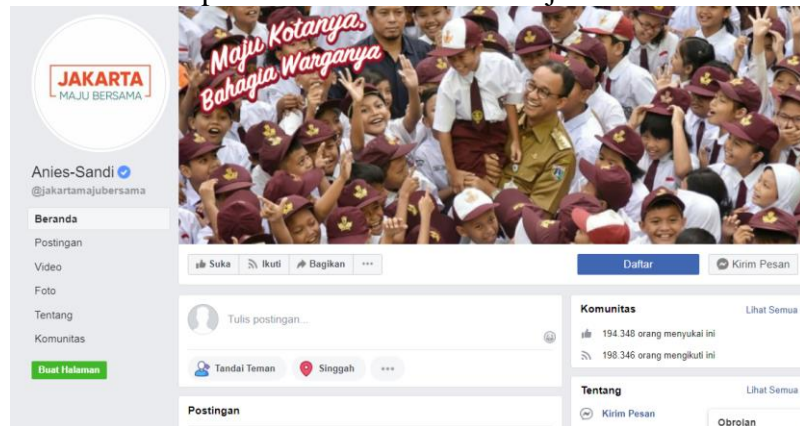
Gambar 3.3 Tampilan Facebook Jakarta Maju Bersama