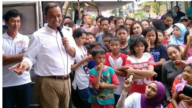
Gambar 3.18 Anies Baswedan Saat Kampanye Langsung Kepada Masyarakat di Batik