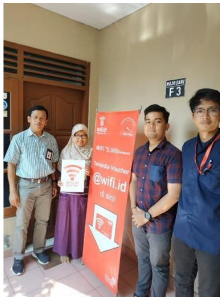
Gambar 11. Kegiatan promosi WiCo menggunakan X- Banner Tahun 2019

X-Banner merupakan salah satu media yang berfungsi sebagai alat untuk mendukung dalam kegiatan promosi. PT. Telkom Witel Yogyakarta menggunakan X-Banner ketika sedang melakukan kegiatan promosi door to door .