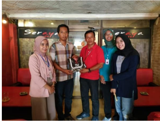
Gambar 16. Kegiatan Promosi Penjualan di Seraya Cafe