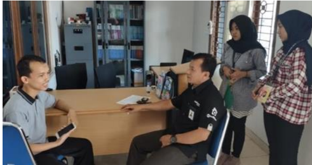
Gambar 13. Kegiatan Penjualan Personal Tahun 2019

Sumber : Assistant Manager Bisnis Territory Sales