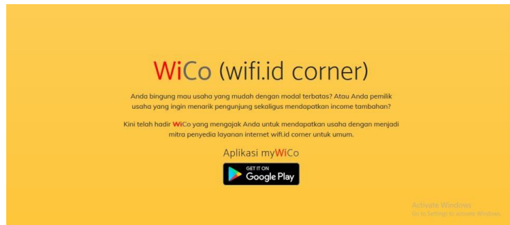
Gambar 7. Website resmi Wifi Corner yang dimiliki oleh PT.