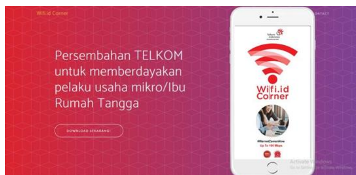
Gambar 6. Website resmi Wifi Corner yang dimiliki oleh PT.