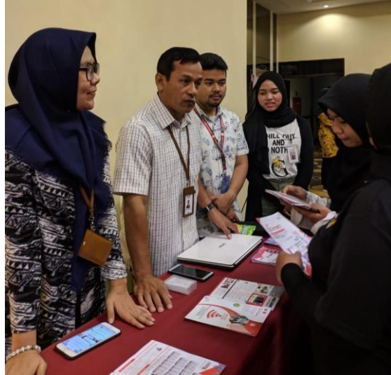
Gambar 14. Kegiatan pemasaran langsung di event NES (New Entrepreneurs Society) di Hotel New Saphir Tahun 2019

Berikut ini adalah contoh gambar yang dilakukan dalam melakukan kegiatan pemasaran langsung: