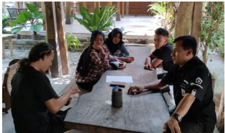
Gambar 12. Kegiatan Penjualan Personal Tahun 2019

Berikut ini adalah contoh gambar yang dilakukan oleh Sales WiCo dalam melakukan kegiatan penjualan personal: