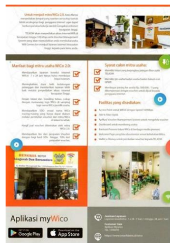
Gambar 10. Brosur WiCo Tahun 2018

Sumber : Assistant Manager Bisnis Territory Sales