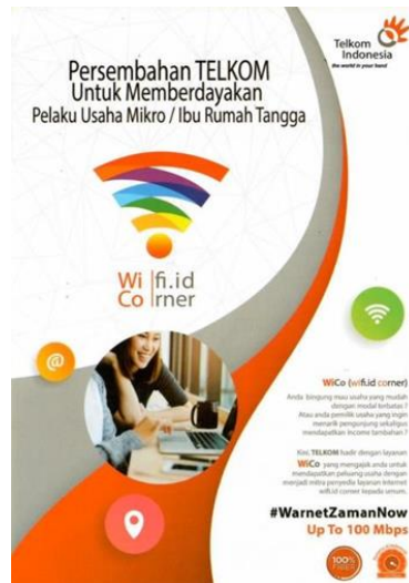
Gambar 9. Brosur WiCo Tahun 2018

sudah lengkap sesuai dengan kebutuhan internet yang dibutuhkan.