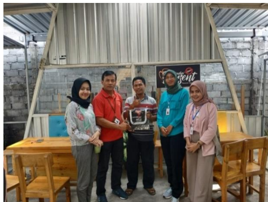
Gambar 15. Kegiatan Promosi Penjualan di Kedai Harsent

Berikut ini adalah contoh gambar yang dilakukan dalam melakukan kegiatan promosi penjualan: