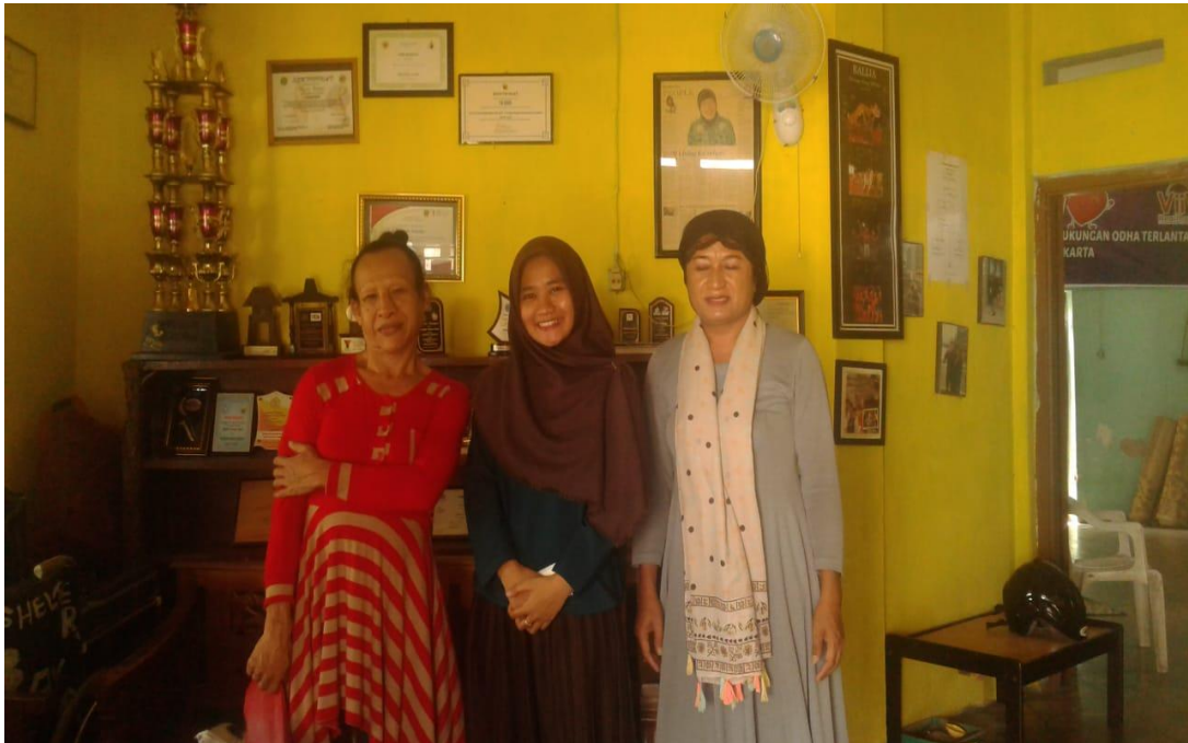
Gambar 2 Foto Bersama waria LSM Kebaya (Subjek 2 & 3)