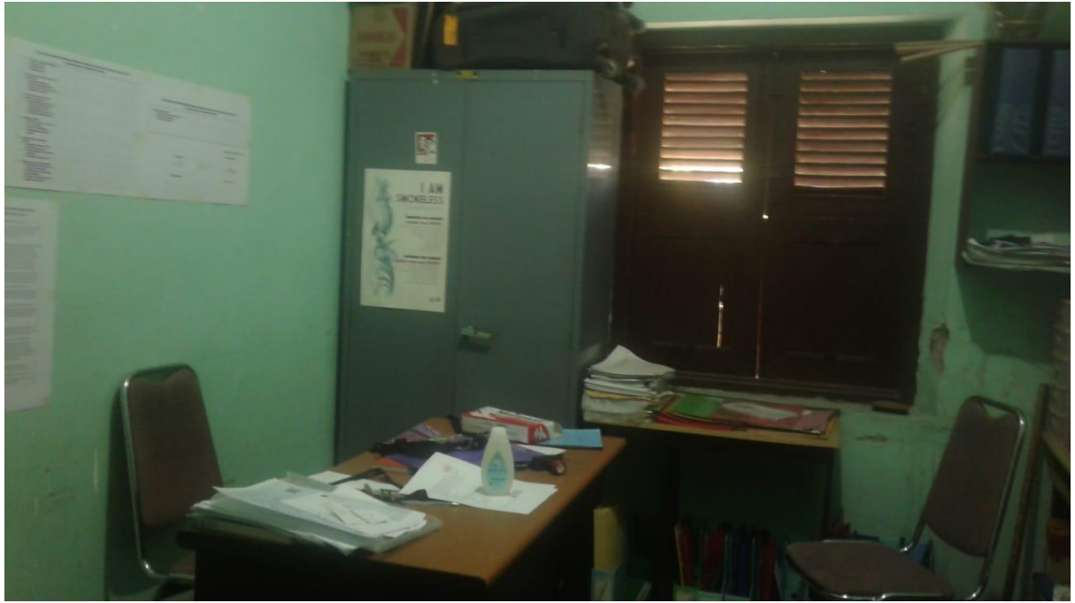
Gambar 3 Ruang kantor LSM Kebaya