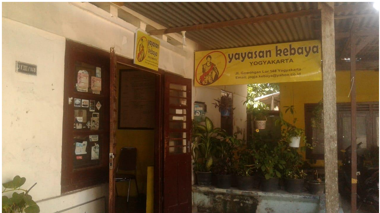
Gambar 4 Gedung LSM Kebaya