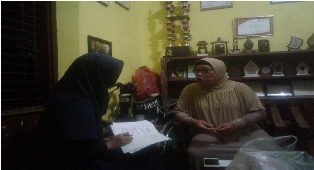
Gambar 1 Wawancara mendalam (Subjek 1)