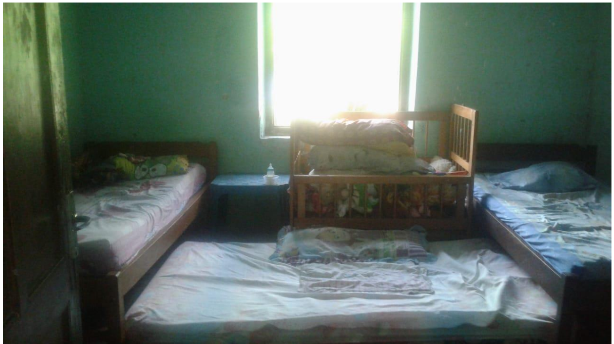
Gambar 6 Ruangan untuk menampung Pasien HIV/AIDS