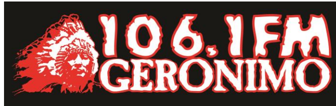
Gambar 2. 1 Logo Radio Geronimo