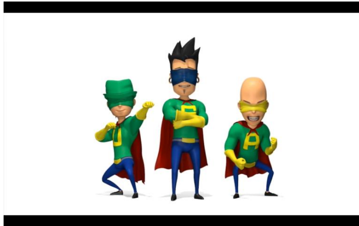
Gambar 2.20 Karakter Super USA