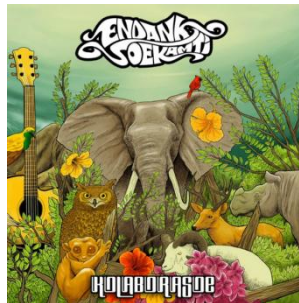
Gambar 2.7 Cover Album Kolaborasoe