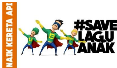
Gambar 2.17 #SaveLaguAnak