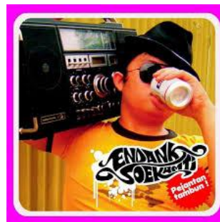
Gambar 2.3 Cover Album Pejantan Tambun