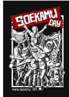
Gambar 2.8 Cover Album Soekamti Day