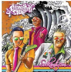
Gambar 2.5 Cover Album Soekamti.com