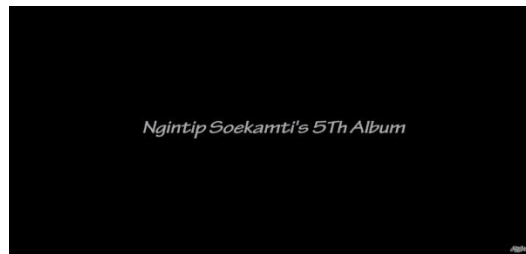
Gambar 2.10 #TheMakingofAngka8