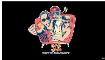
Gambar 2.18 The Story of Soekamti Day