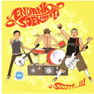
Gambar 2.4 Cover Album Ssstt...!!