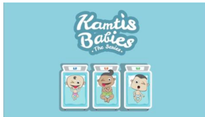
Gambar 2.16 Kamtis Babies The Series