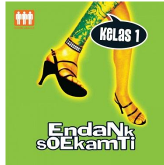
Gambar 2.2 Cover Album Kelas 1