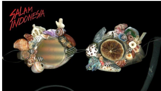
Gambar 2.9 Cover Album Salam Indonesia