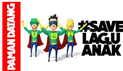
Gambar 2.19 #SaveLaguAnak