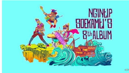
Gambar 2.13 Ngintip Soekamti's 8 th Album