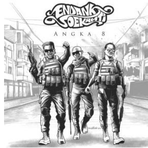
Gambar 2.6 Cover Album Angka 8