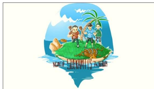
Gambar 2.12 Ngintip Soekamti’s 7 th Album