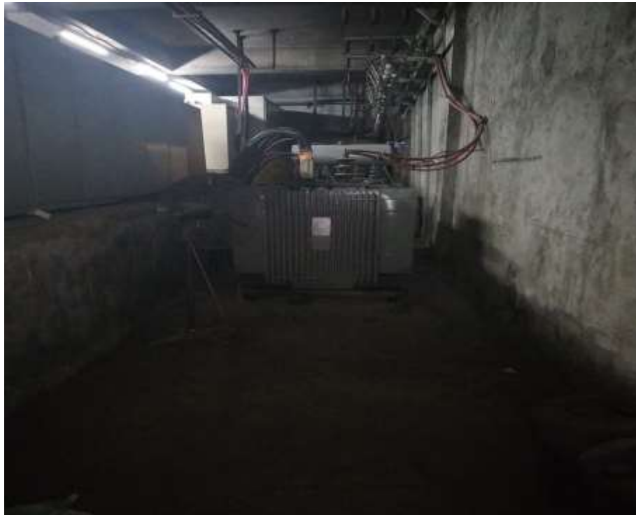
Panel Distribusi di Gedung Ramai Mall Yogyakarta