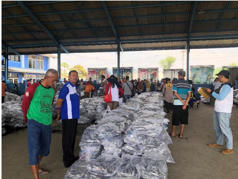
Area tempat pelelangan atau tempat transaksi jual-beli ikan TPI Unit II Juwana.