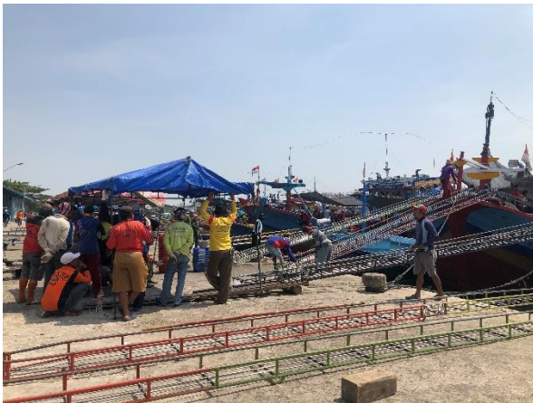
Dokumentasi di area penurunan ikan hasil tangkapan ke TPI