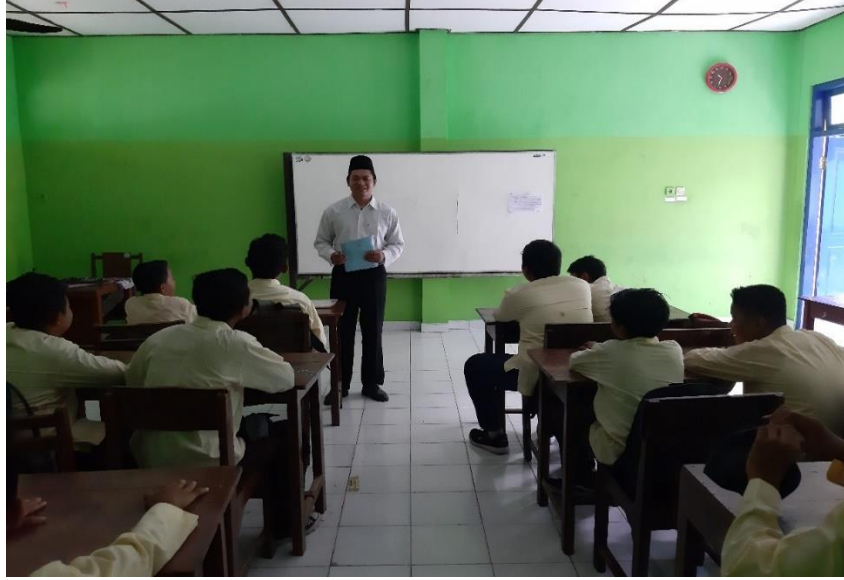
الباحثة مع معلم اللغة العربية في الفصل السابع