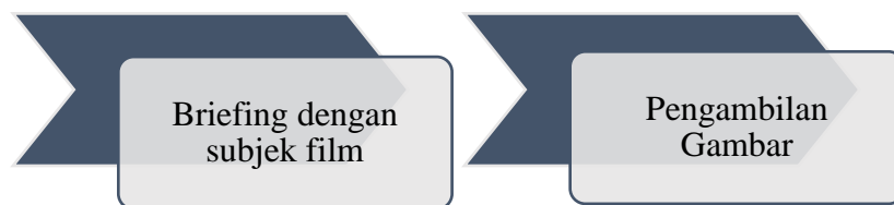
Bagan 1. Alur Produksi Film Bulu Mata

Setelah semua proses pra produksi di rasa selesai dan dapat melanjutkan ke tahap berikutnya, maka tahap selanjutnya yaitu masuk pada tahap produksi yang mana semua yang sudah di rencanakan di tahap pra produksi dapat berjalan sesuai harapan. Didalam produksi film Bulu Mata yaitu adanya persiapan dan pengecekan alat serta melakukan pengambilan gambar sesuai jadwal produksi yang ada.