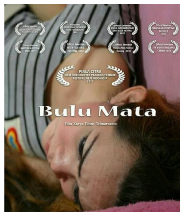
Gambar 1. Poster Film Dokumenter Bulu Mata

Film diketahui mempunyai beberapa genre yang paling digemari audiens yaitu drama, horor, aksi, sejarah, percintaan dan komedi (Marta & Suryani, 2016). Ada satu genre yang sangat awam bagi kebanyakan orang yaitu film dokumenter karena dari segmentasi penontonnya berbeda dengan film fiksi atau film yang dikomersilkan. Film dokumenter dianggap oleh sebagian orang sebagai tayangan berdurasi panjang yang menampilkan beauty shots , dan sebagian lagi menyebut film dokumenter mempertontonkan tentang faktual secara detail serta orang melihat dokumenter sebagai sebuah video yang bercerita tentang satwa liar dan kehidupan suku pedalaman (Jauhari, 2012).