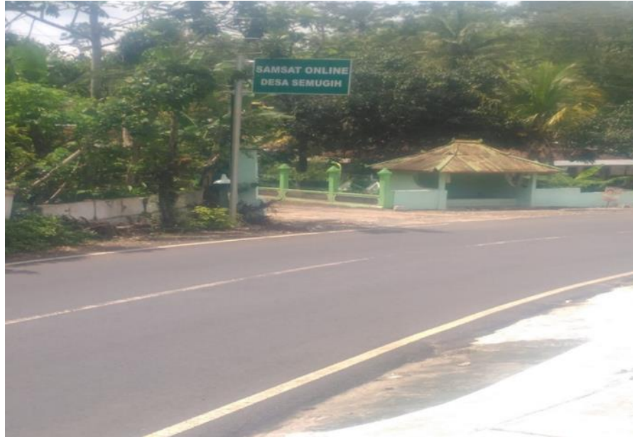
Gambar VIII Standar Mutu Pelayanan