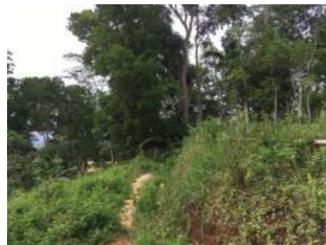
b. Observasi kondisi Puncak