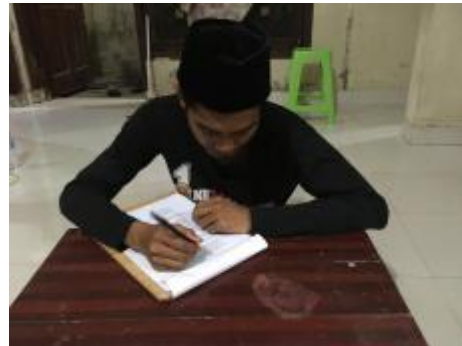
b. Pemberian kuesioner kepada masyarakat