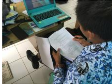
a. Pemberian Kuesioner kepada instansi terkait