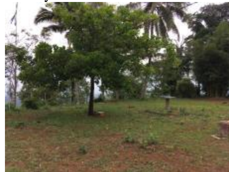
a. Gambaran kondisi Puncak