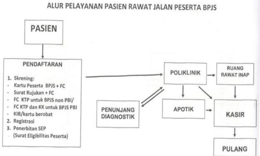
Gambar 4.2 Alur Pelayanan Pasien dengan BPJS