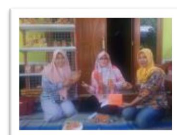
Kunjungan dari luar