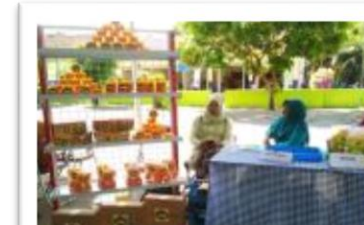
Pameran di Balai Desa