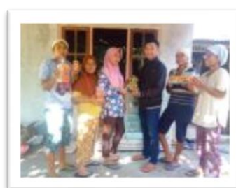
Kunjungan dari Mahasiswa