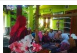
Rapat rutin kelompok