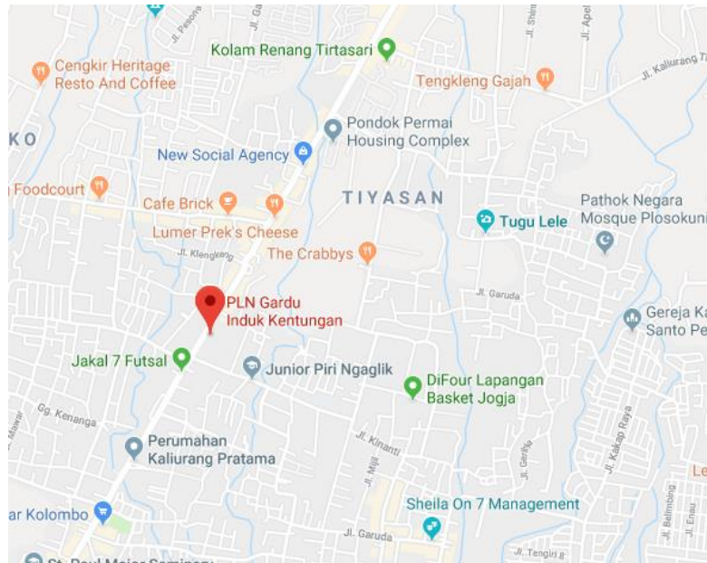
Gambar 3. 1 Daerah lokasi penelitian

Penelitian tugas akhir ini dilakukan pada PT. PLN (persero) Yogyakarta tepatnya Gardu Induk 150 KV Kentungan yang beralamat di Jl. Kaliurang KM 7,8, Ngabean Kulon, Sinduharjo, Sleman, Kabupaten Sleman, Daerah Istimewa Yogyakarta 55581, seperti dapat dilihat pada Gambar 3.1 berikut ini: