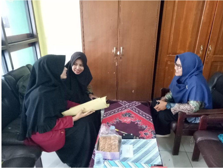
Wawancara dengan Wali Kelas/Guru dan Operator Madrasah