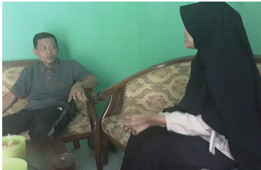
Wawancara dengan Orang Tua Siswa