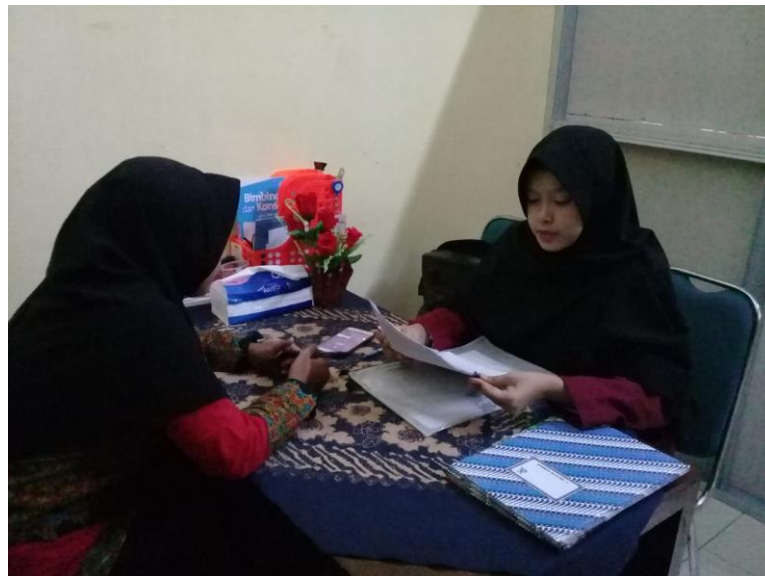
Wawancara dengan Guru BK