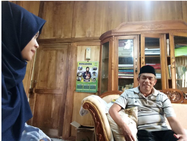
Wawancara dengan Pimpinan Yayasan Pendidikan Islam “Andalusia”