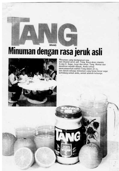
Gambar 3.4 Iklan Tang, Femina, No. 136, 20 Juni 1978, hal 105

Disamping itu masifnya program KB juga dimanifestasikan melalui bentuk-bentuk lain yang cukup dekat dengan kehidupan masyarakat. Seperti salah satunya pada iklan komersial mengambil cuplikan gambar tentang konsep keluarga utuh sehat dan bahagia.