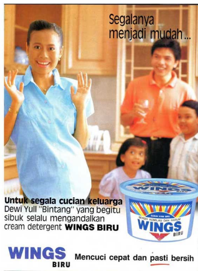
Gambar 3.8 Iklan Wings, Femina, No. 9, 28 Feb—6 Maret 1991, hal 60.

Menurut Alia Swastika (2017) penerapan program pembatasan jumlah penduduk di Indonesia pada masa Orde