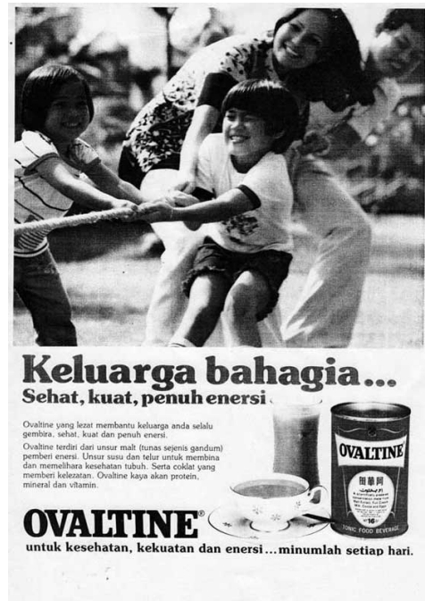
Gambar 3.5 Iklan Ovaltine, Kartini, No. 158, 24 Nop s/d 7 Des 1980, hal 30