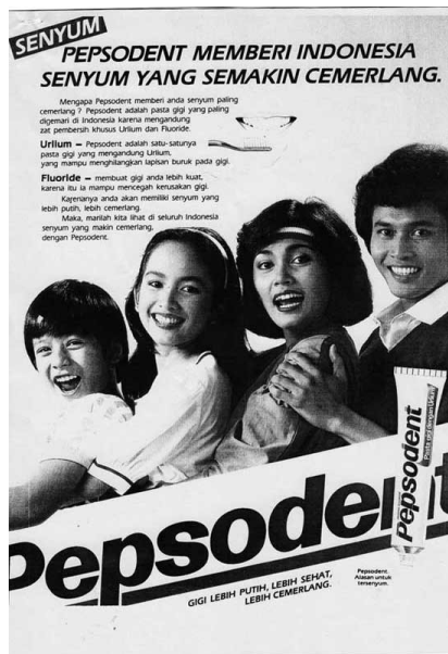
Gambar 3.7 Iklan Pepsodent, Kartini, No. 298, 21 Apr—4 Mei 1986, hal 297.