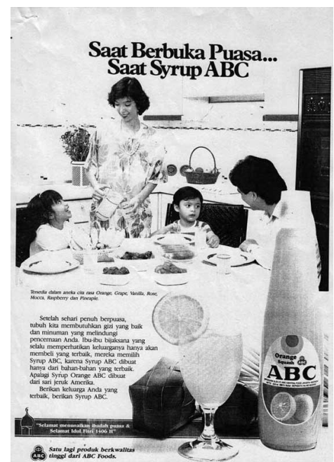
Gambar 3.6 Iklan ABC, Kartini, No. 300, 19 Mei—1 Juni 1986.