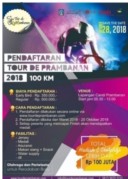
Gambar 2.4 Logo Tour de Prambanan 2018