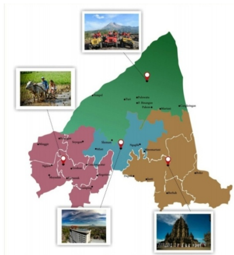
Gambar 2.1 Denah Lokasi Kabupaten Sleman

Sleman merupakan salah satu Kabupaten yang berada di Daerah Istimewa Yogyakarta. Secara geografis Kabupaten Sleman terletak diantara 110^{\circ} 33' 00'' dan 110^{\circ} 13' 00'' Bujur Timur, 7^{\circ} 34' 51'' dan 7^{\circ} 47' 30'' Lintang Selatan. Wilayah Kabupaten Sleman sebelah utara berbatasan dengan kabupaten Boyolali, Provinsi Jawa Tengah, sebelah timur berbatasan dengan Kabupaten Klaten, Provinsi Jawa Tengah, sebelah barat berbatasan dengan Kabupaten Kulon Progo, Provinsi DIY dan Kabupaten Magelang, Provinsi Jawa Tengah dan sebelah selatan berbatasan dengan Kota Yogyakarta , Kabupaten Bantul dan Kabupaten Gunung Kidul, Provinsi D.I.Yogyakarta.