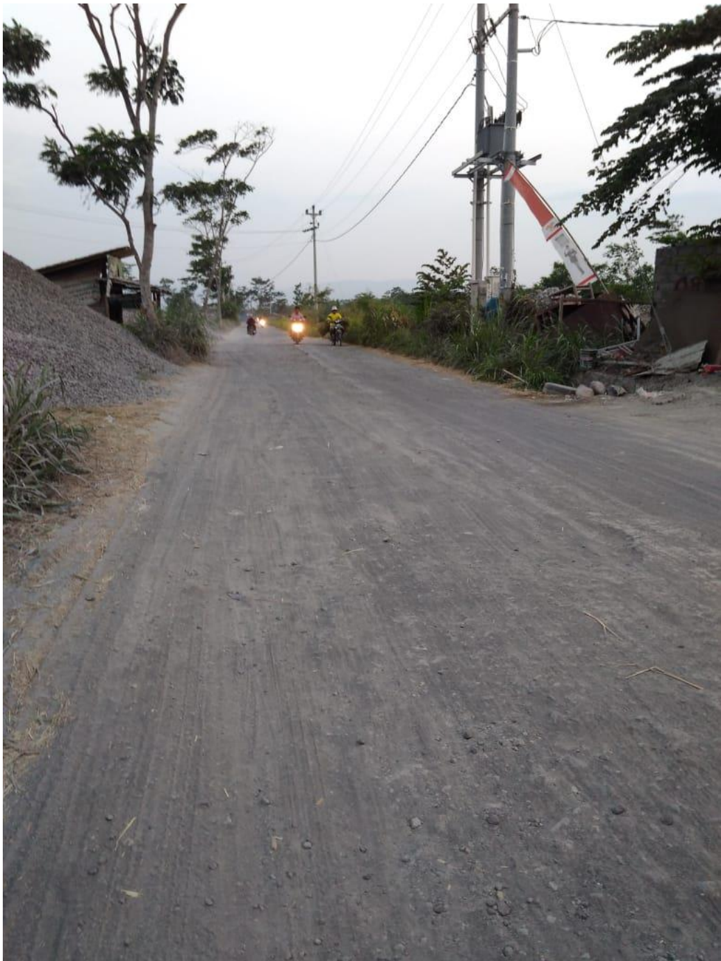
Gambar 7.5 Kondisi Jalan yang Semula Beraspal