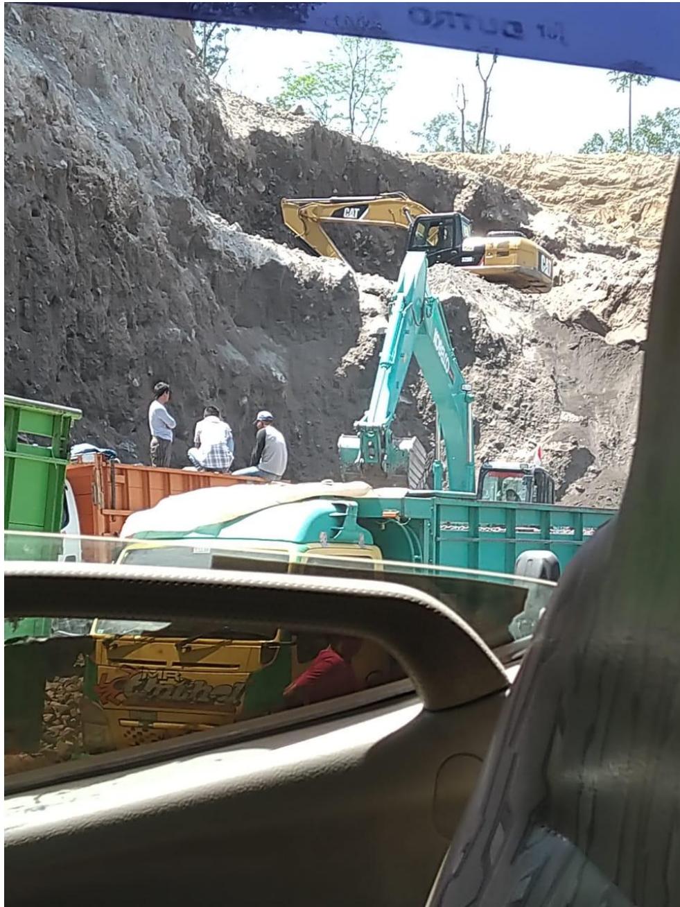
Gambar 7.1 Aktivitas Pertambangan di Kali Woro Kecamatan Kemalang