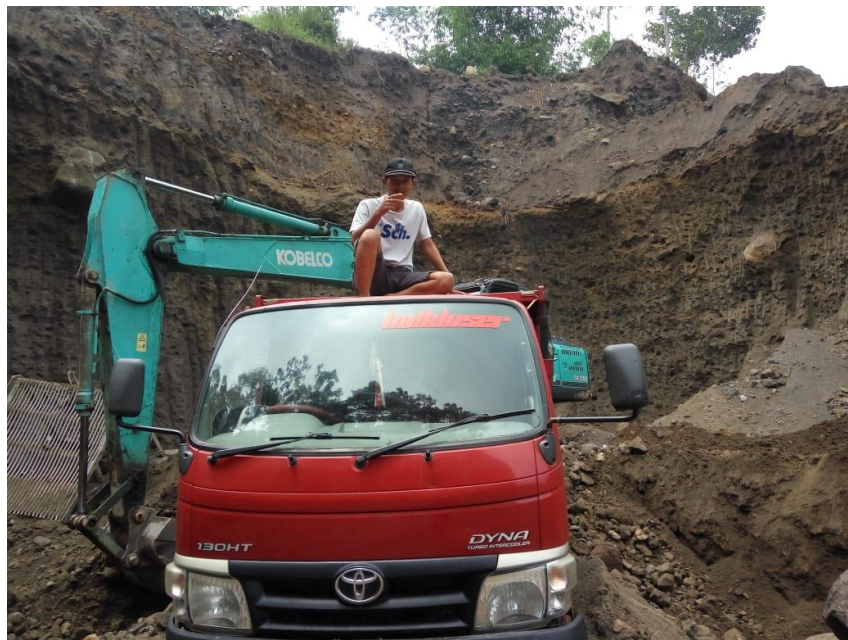
Gambar 7.3 Bahan Galian Golongan C Jenis Pasir