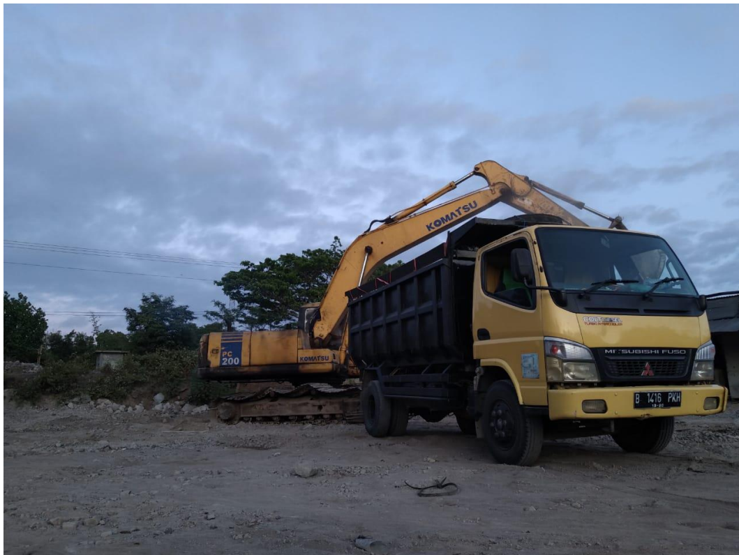
Gambar 7.2 Aktivitas Pertambangan Menggunakan Alat Berat