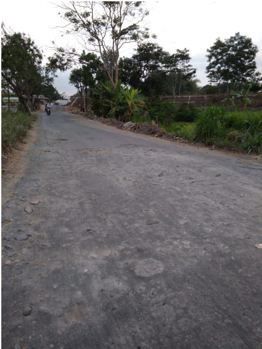
Gambar 7.4 Kondisi Jalan yang Rusak