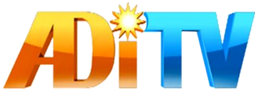
Gambar 2.1. Logo ADITV.