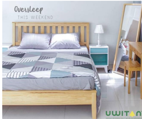
Gambar 2.7 Classic Bed Uwitan