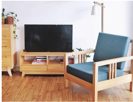
Gambar 2.9 Alana Sofa 1 Seater Uwitan