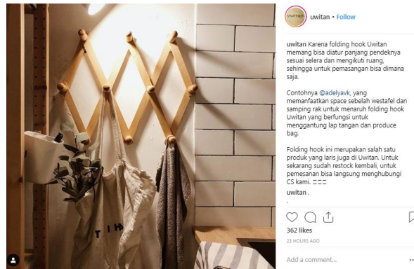
Gambar 2.11 Halaman postingan Uwitan