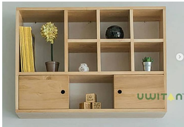
Gambar 2.6 Rak Dinding Uwitan