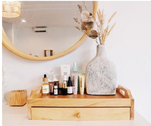
Gambar 2.10 Storage Tray