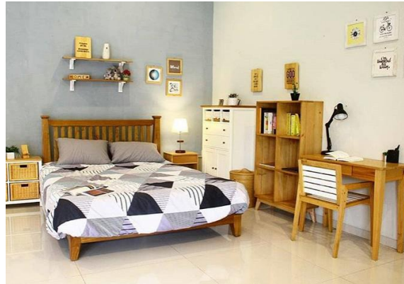
Gambar 2.1 Salah satu bagian display toko Uwitan