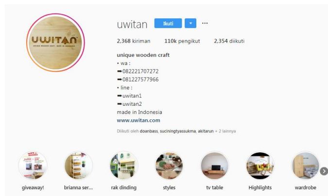
Gambar 2.5 Halaman akun Instagram Uwitan