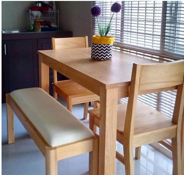
Gambar 2.8 Dining Table Set Uwitan