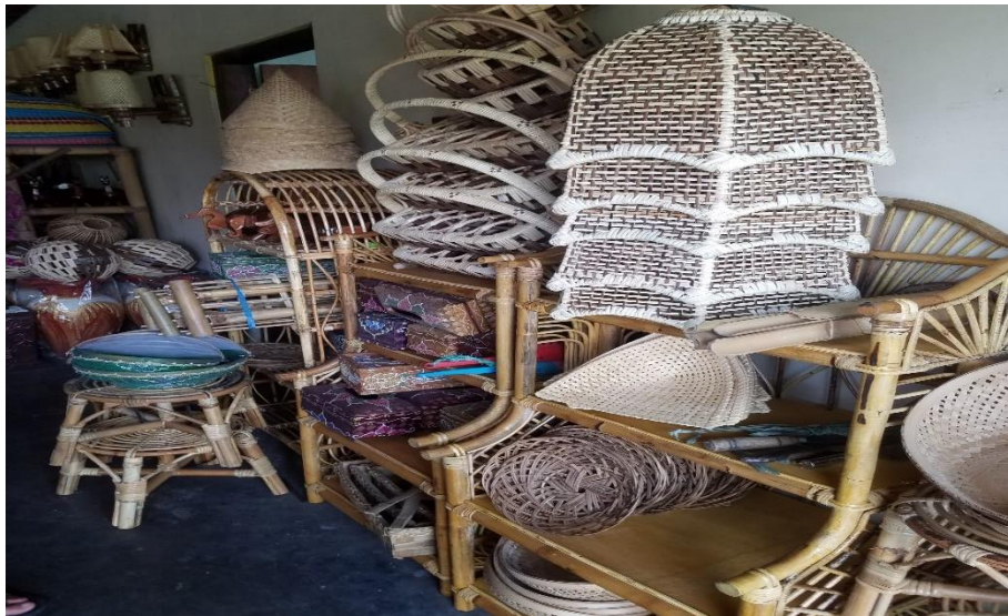
Gambar.2 penyebaran kuesioner dan wawancara secara langsung kepada pelaku UMKM di Kabupaten Sleman kerajinan Bambu dan rotan