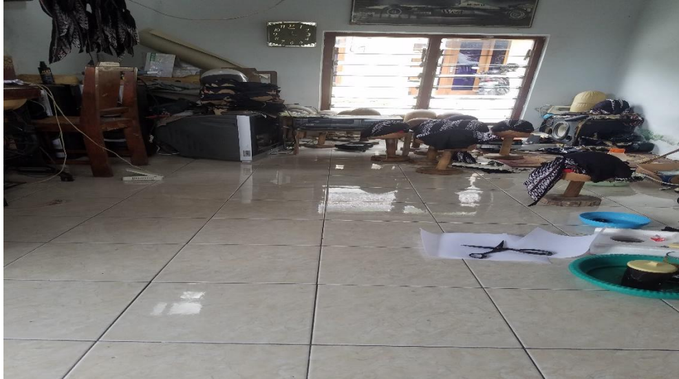
Gambar 3. penyebaran kuesioner dan wawancara secara langsung kepada pelaku UMKM di Kabupaten Sleman kerajinan blangkon