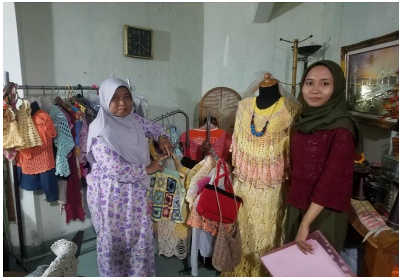
Gambar 1. Pengisian kuesioner dan wawancara secara langsung kepada pelaku UMKM di Kabupaten Sleman pada sektor kerajinan renda