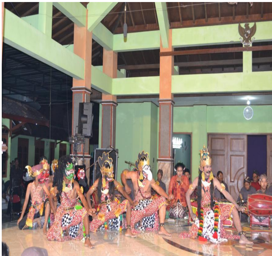
Gambar 3.1 (Sosialisasi smart city berupa pertunjukan wayang)