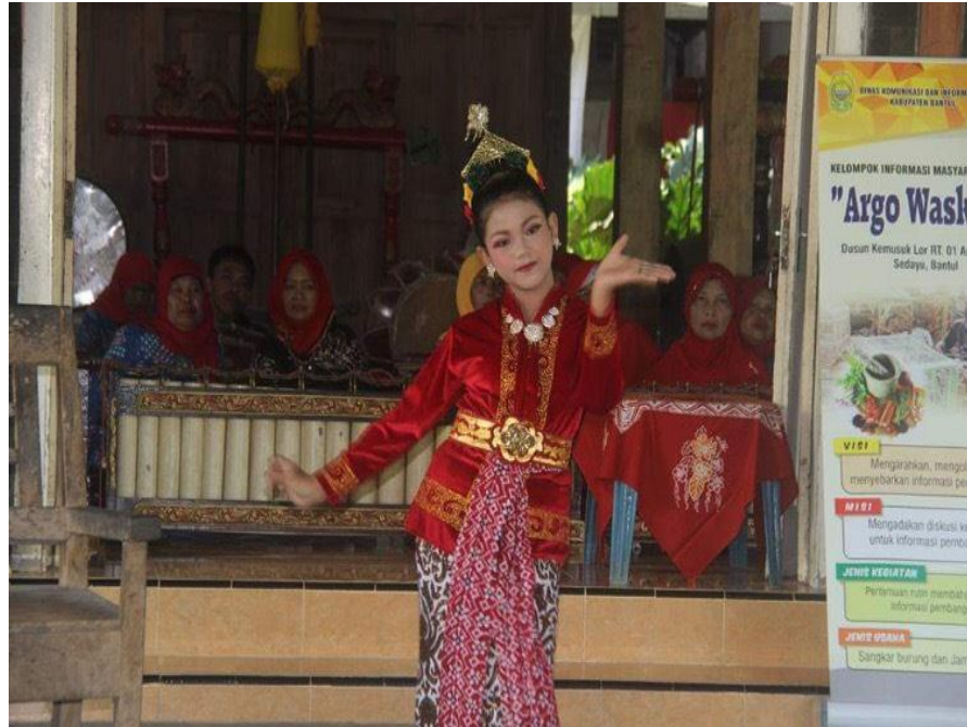
Gambar 3.2 (Sosialisasi smart city berupa pertunjukan tarian tradisional)