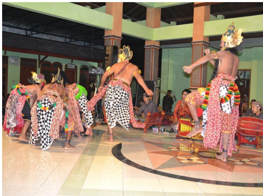
Gambar 3.5 (Sosialisasi Petunra Bantul)