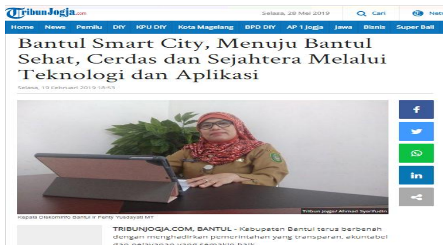
Gambar 3.9 (Pemberitaan media online oleh Tribun Jogja )

Konten dalam unggahan pada Website maupun media sosial pada Pemkab dan Dinas kominfo Bantul bersifat interaktif dan lebih menginformasikan, mengedukasi dan memberitahu kepada masyarakat akan adanya program smart city di Wilayah Kabupaten Bantul Yogyakarta. Media online yang digunakan adalah Website , Facebook , Instagram , dan Youtube . Penggunaan kanal berita online seperti Tribun Jogja dan lain sebagainya juga dilakukan. Oleh sebab itu dalam menyampaikan pesannya Dinas Kominfo memaksimalkan berbagai penggunaan media yang ada.