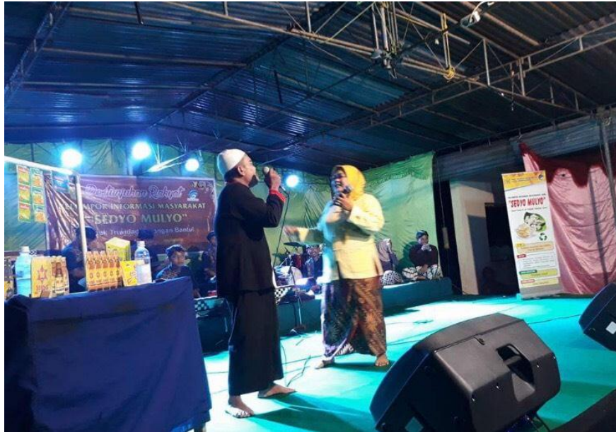
Gambar 3.4 (Sosialisasi Petunra Bantul)