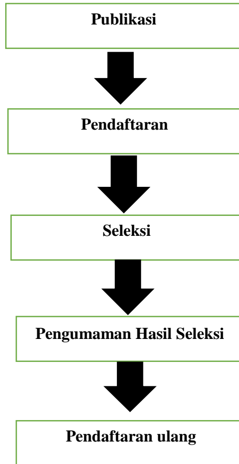
Gambar 2.1 Tahapan PPDB

PPDB jenajng SMP dilaksanakan melalui tahapan: