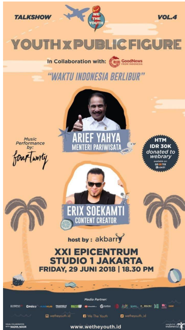
Gambar 7: Media Partner GNFI dengan We The Youth

Event YouthxPublicFigure ini diadakan oleh We The Youth, dan berkolaborasi dengan Good News From Indonesia. We The Youth merupakan gerakan gerakan yang mendorong anak muda untuk menjadi generasi peduli dan berinisiatif.