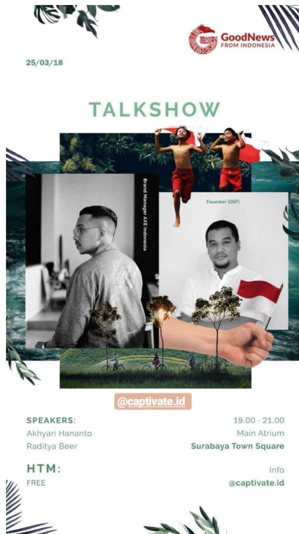
Gambar 6: Media Partner GNFI dengan @captivate.id