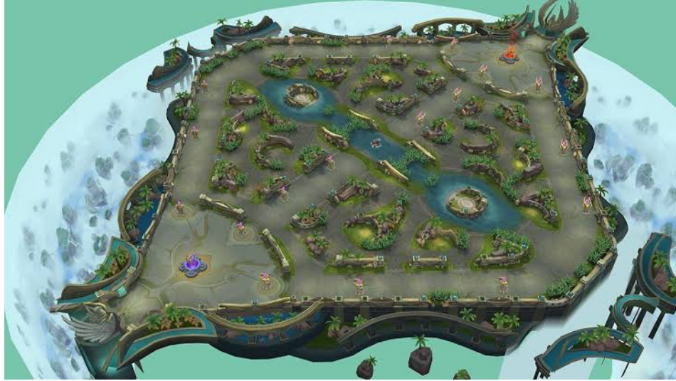
Gambar 6: Maps Game Online Mobile Legends ( https://encrypted-tbn0.gstatic.com/images?q=tbn%3AAND9GcSHyvBuZvARmziClw-5zywa8upCTMxuV1-_1vp7xYiLgg-2L28B , 13 November 2018)