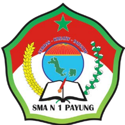
Gambar 1: Logo SMA Negeri 1 Payung