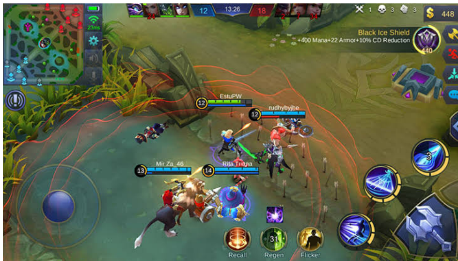
Gambar 5: Proses Permainan Game Online Mobile Legends ( https://encrypted-tbn0.gstatic.com/images?q=tbn%3AAND9GcSHyvBuZvARmziClw-5zywa8upCTMxuV1-_1vp7xYiLgg-2L28B , 13 November 2018)