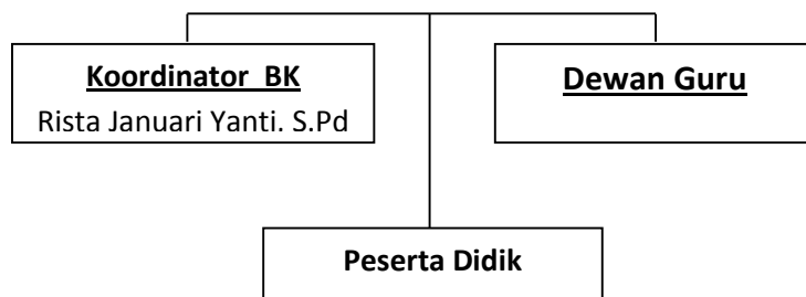
Bagan 1: Struktur Organisasi SMA Negeri 1 Payung (Doc. SMA N 1 Payung, 28 September 2018)

Adapun daftar pendidik dan tenaga kependidikan SMA Negeri 1 Payung, dapat dilihat sebagai berikut: