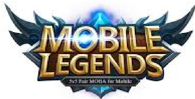
Gambar 2: Lambang Game Online Mobile