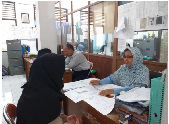
awawancara denan pekerja sosial 2