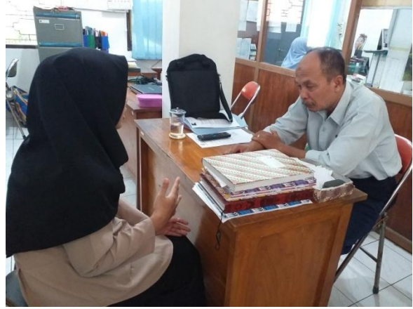
Wawancara dengan pekerja sosial 1