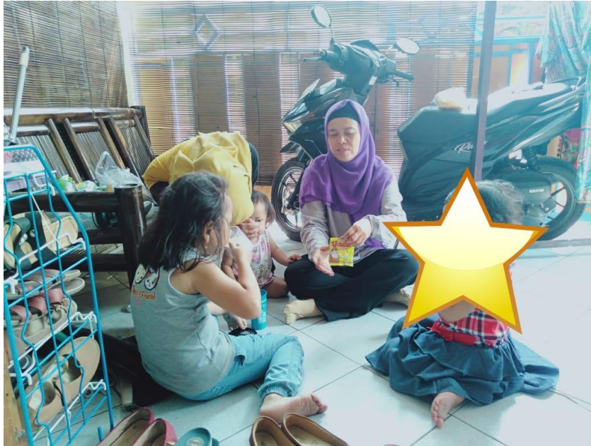
Keterangan: Pendampingan dilakukan diluar P2TPAKK “Rekso Dyah Utami”