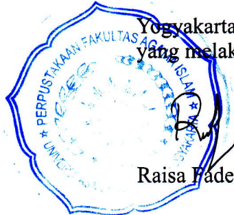
Laela Niswatin, S.I.Pust.

Yogyakarta, 2019-08-09 yang melaksanakan pengecekan