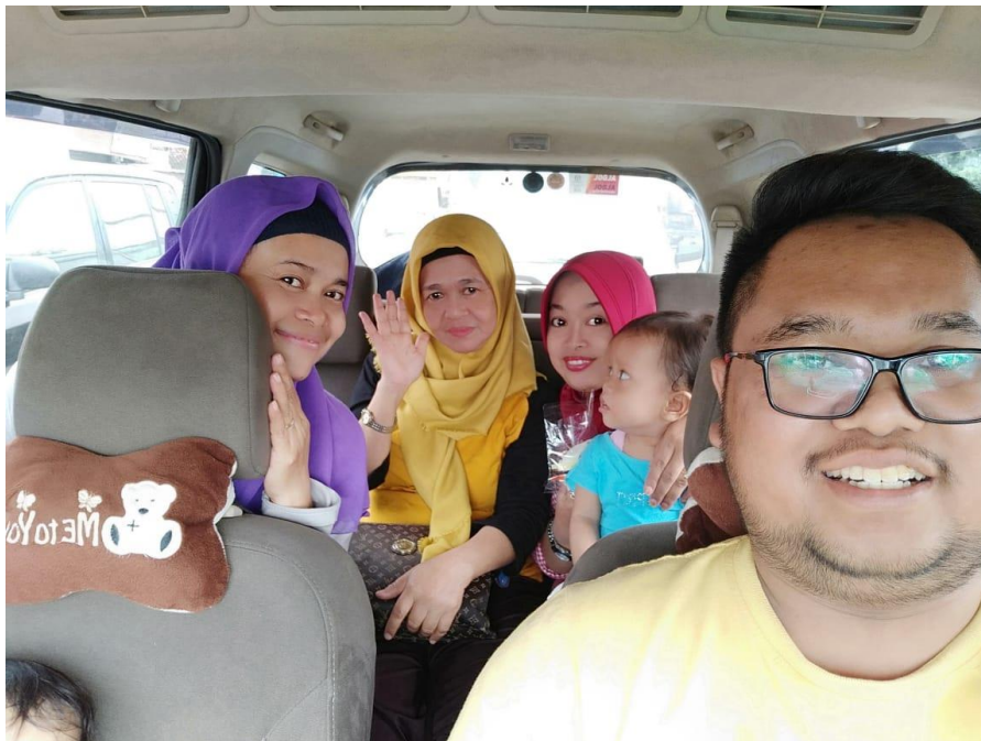
Keterangan: Menuju ke Polda DIY