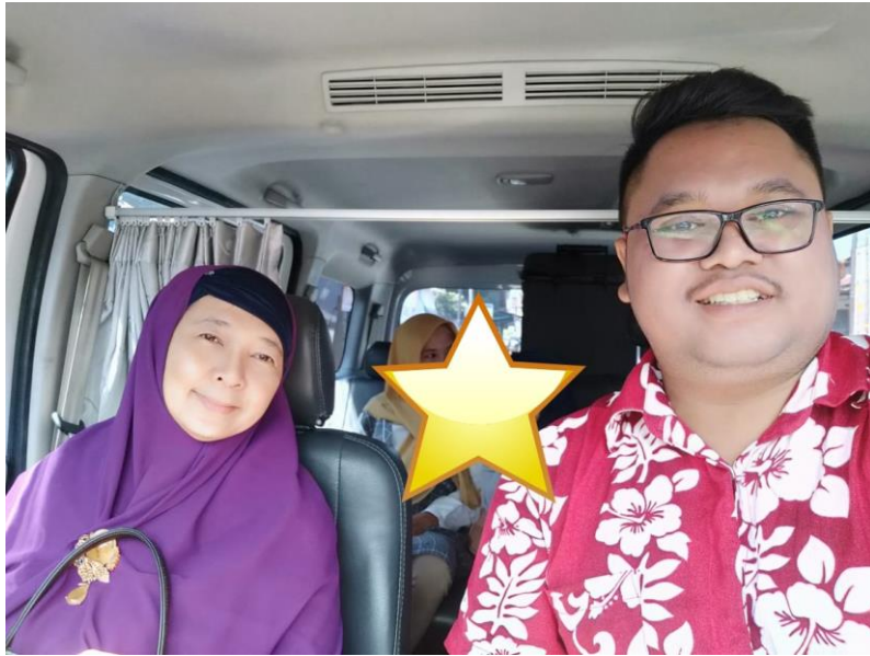
Keterangan: Foto diambil saat perjalanan menuju Polda DIY