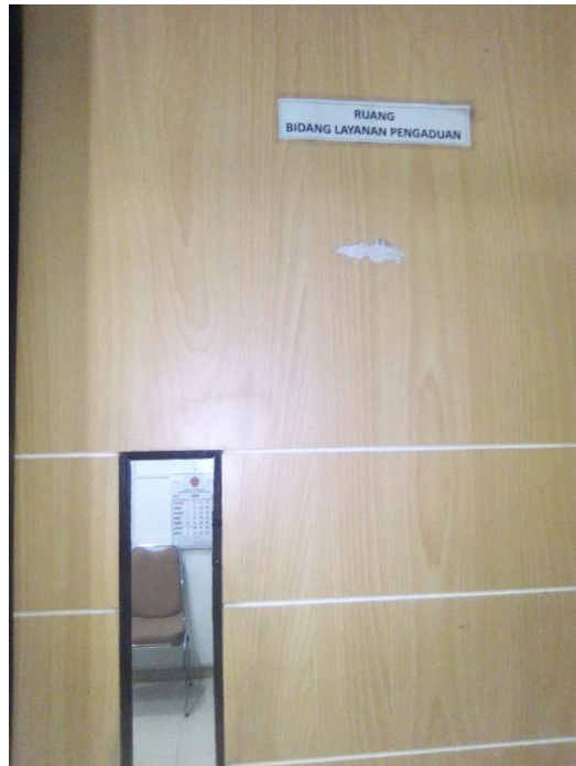
Keterangan: Foto diambil saat observasi