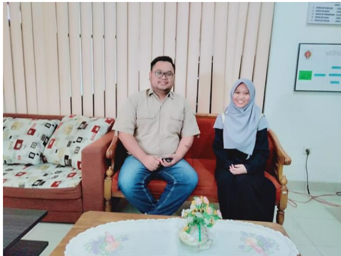
Keterangan: Foto diambil setelah wawancara selesai