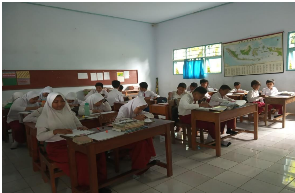
Gambar 3. Tahfiz al-Qur'an kelas VI