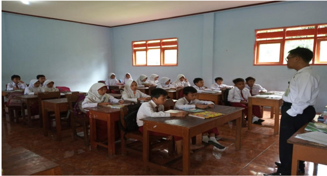
Gambar 2. Tahfiz al-Qur'an kelas V