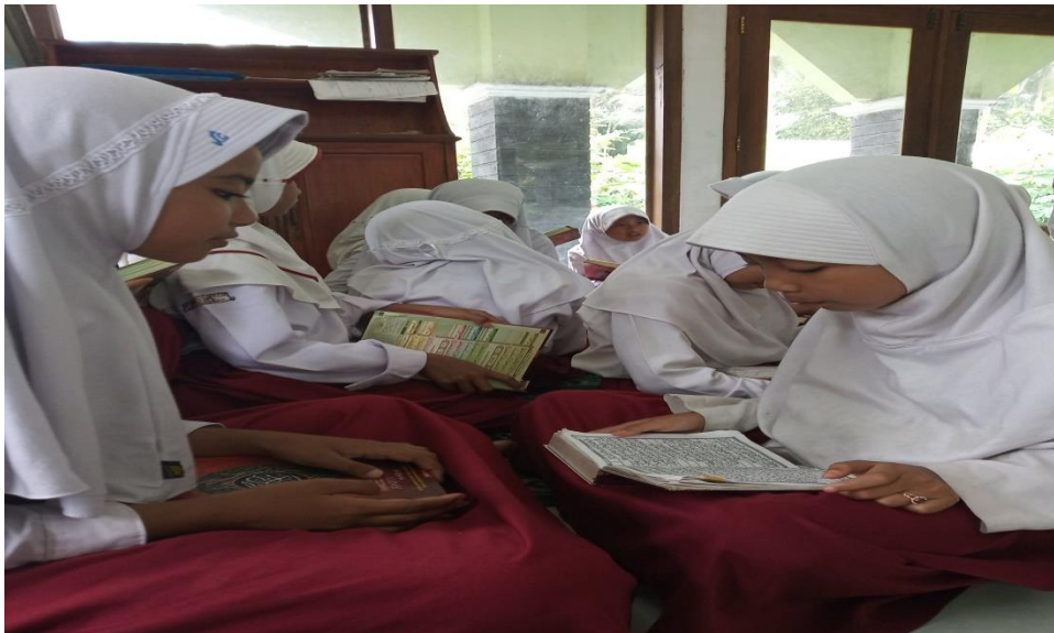
Gambar 5. Setoran dengan teman sebaya