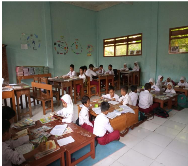
Gambar 1. Tahfiz al-Qur'an kelas IV