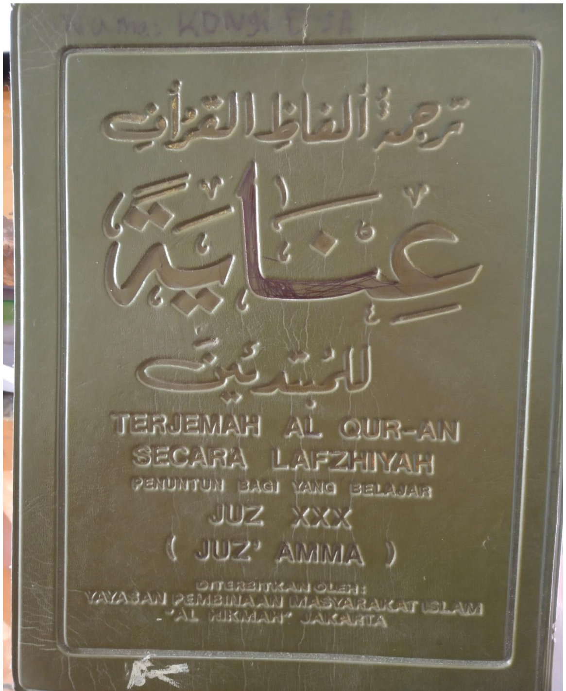
Gambar 7. Buku terjemah lafziyah